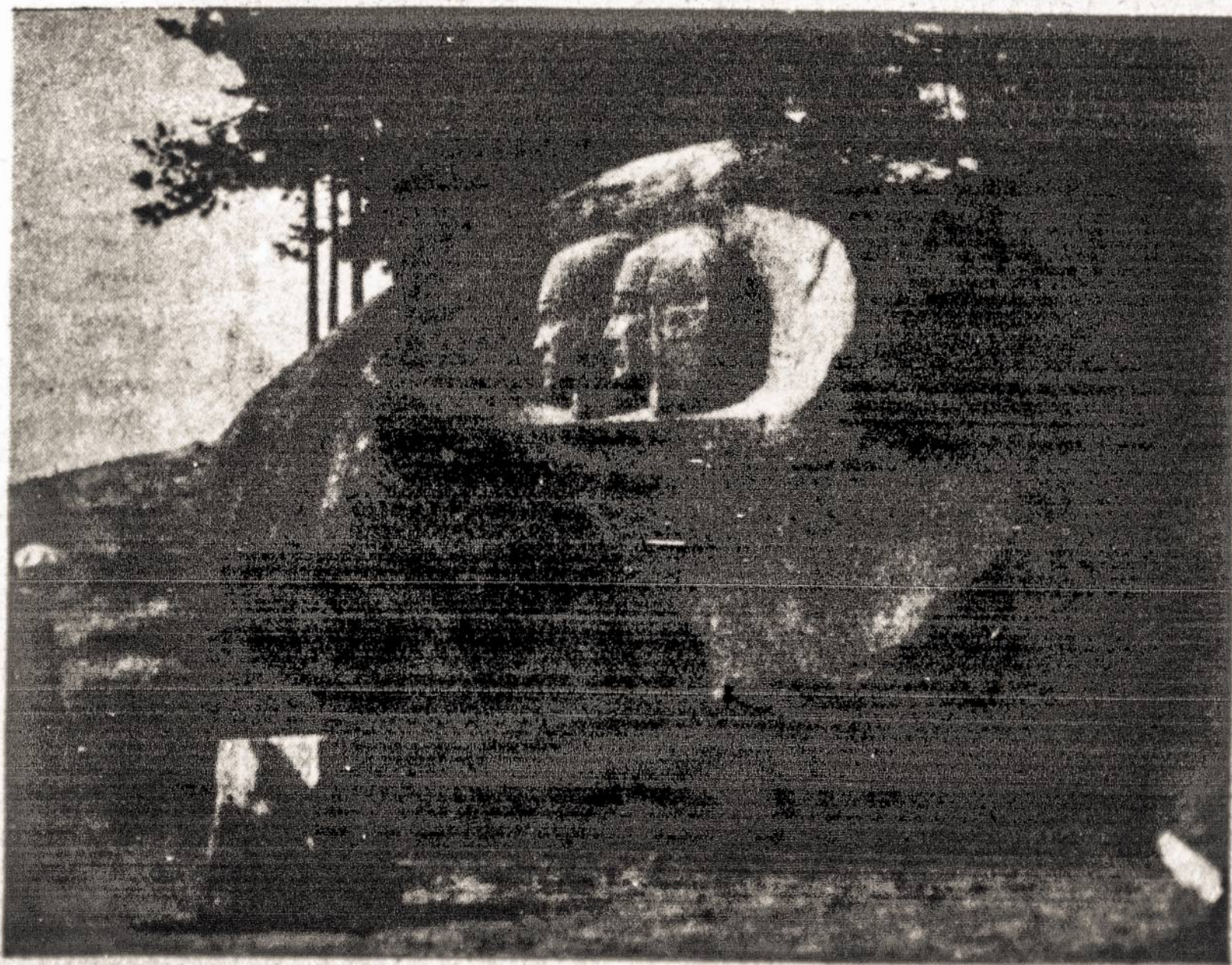
Lietuvoje prie Anykščių Puntuko iškalti Darius - Girėnas.

Mūsų nemirtingųjų, sparnuotų didvyrių Dariaus ir Girėno, prieš 25 metus atliktas žygis pastatė juos šalia to laiko viso pasaulio garsųjų vyrų; o Lietuvai jie at- nešė neapsakomos vertės patar- navimą, nes visas pasaulis turė- jo progą išgirsti apie mūsų tau- tos sūnų dvasios didybę, kurią parodė kilniaširdžiai, nepaprast- os drąsos ir patvarumo karžygiai. Tą garbę mūsų tautai jie pirkė didžiausia kaina - paaukodami sa- vo gyvybę. Jei savo gyvybę žmo- gus aukoja kam nors, tai reiškia, kad jis tam reikalui neturi mei- lės ribų. Darius ir Girėnas pa- mokė mus, visiems laikams, kaip savo tautą reikia mylėti.