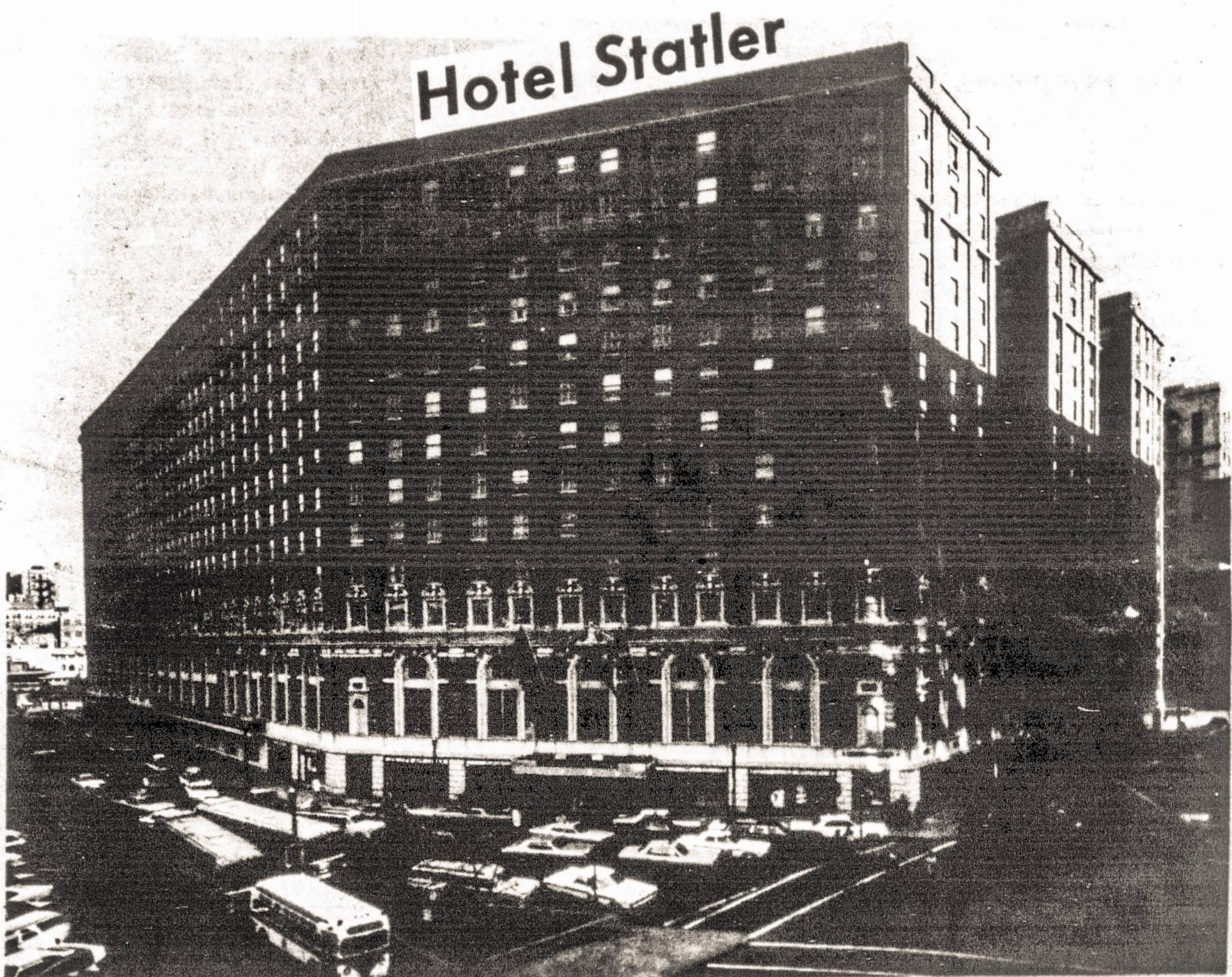
Panorama of Mid-town Boston, showing the central location of Hotel Statler Hilton, the 58th SLA Convention site.

Aleksandras Chaplikas parūpino keletą Bostono Statler viešbučio nuotraukų, kurias talpiname da- bar, kad nariai iš anksto matytų vietą, kurioje posėdžiaus ir beveik savaite laiką praleis.