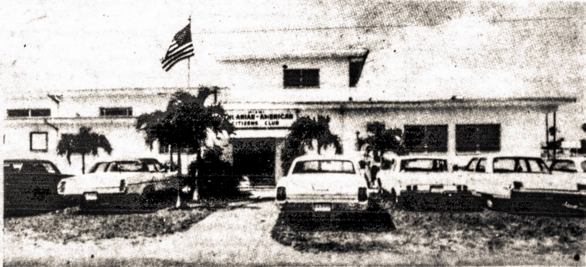
Miami Lietuvių Amerikos Piliečių Klubas.

Taigi, JAV ir Tar. S-goj net 9 milijonai. Toliau - Prancūzijoje žydų yra 550,000, Argentinoje 500,000, Anglijoje 410,000, Kanadoje 300,000.