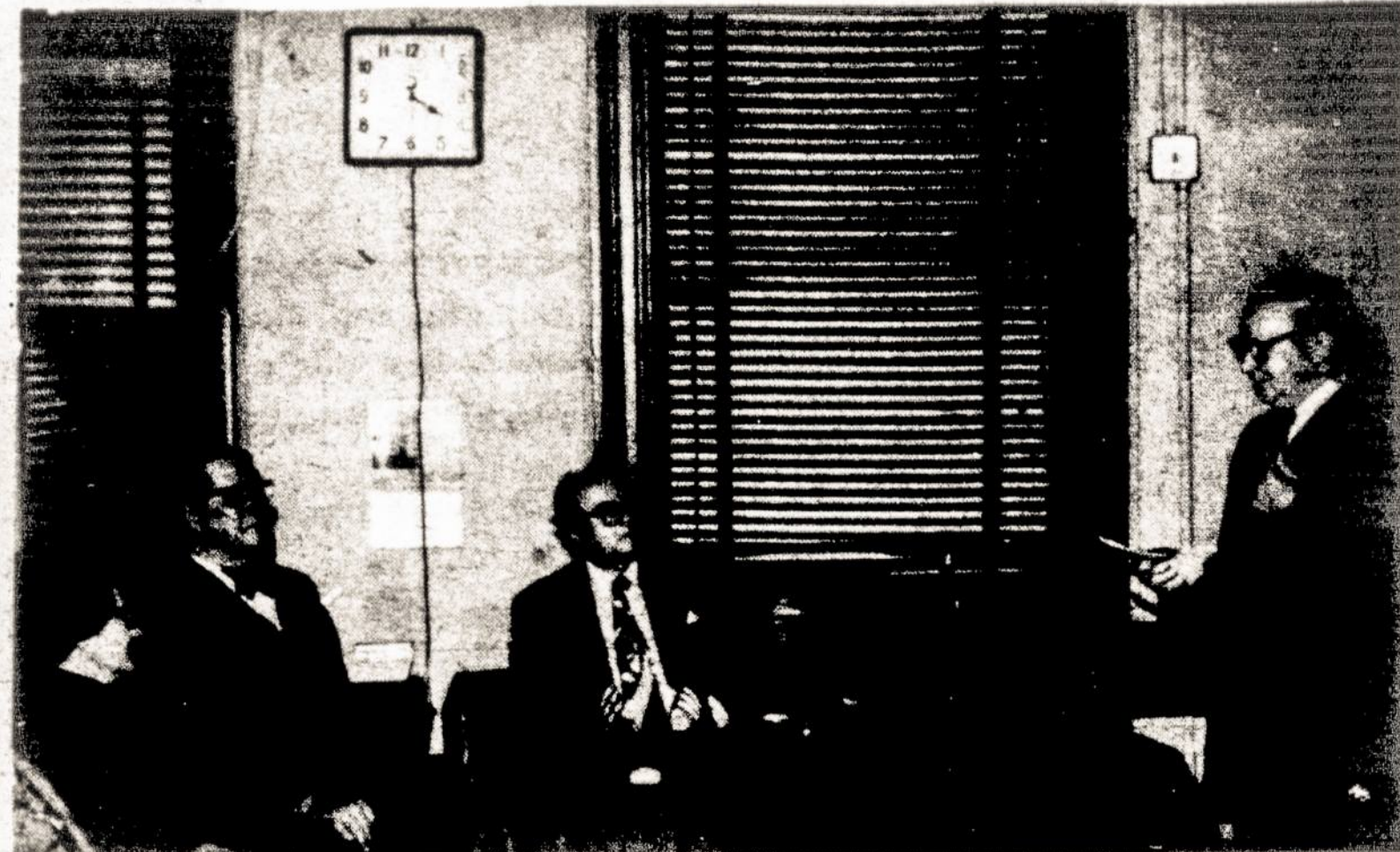
Buvęs SLA 126 Kp. pirmininku poetas Stasys Jakštas skaito savo eilėraščius kovo 2 d. Lietuvos nepriklausomybės minėjime SLA Centre.