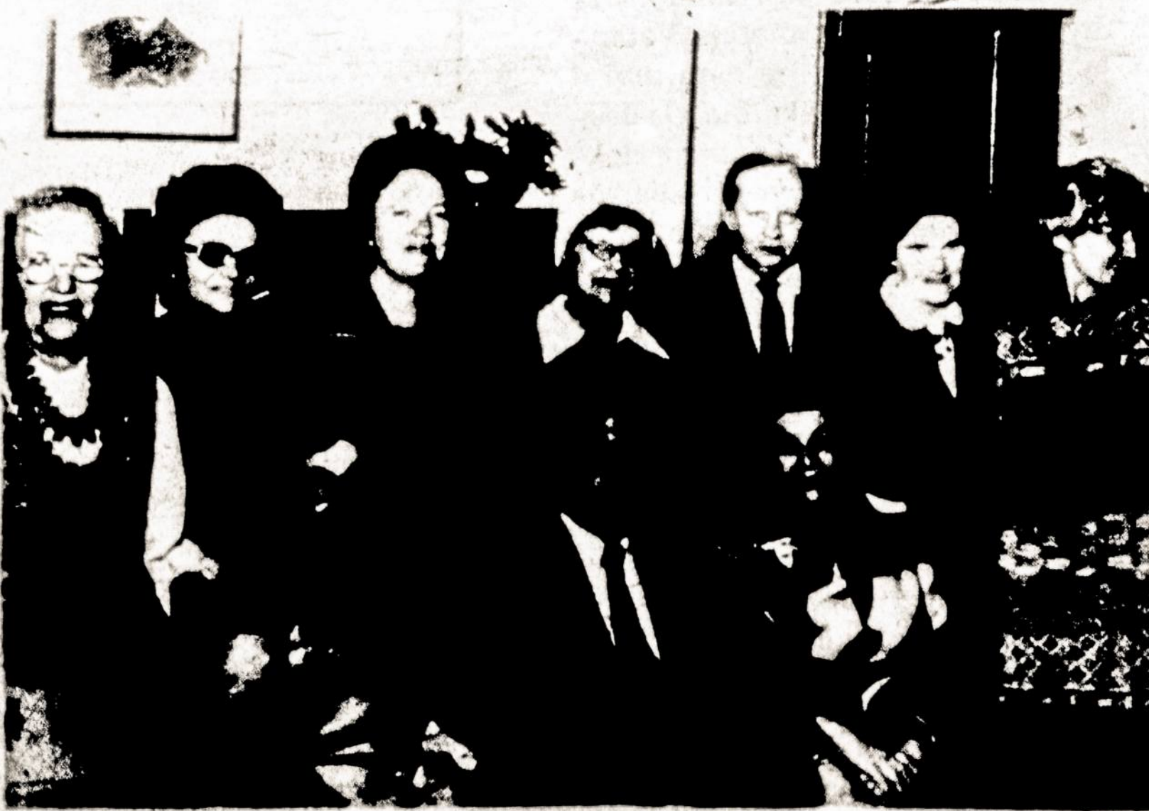
SLA patalpose New Yorke Lietuvos nepriklausomybės paminėjime dalis SLA veikėjų-dalyvių.

Ačiū visiems už atsilankymą, ačiū už dėmesį mano žodžiui.