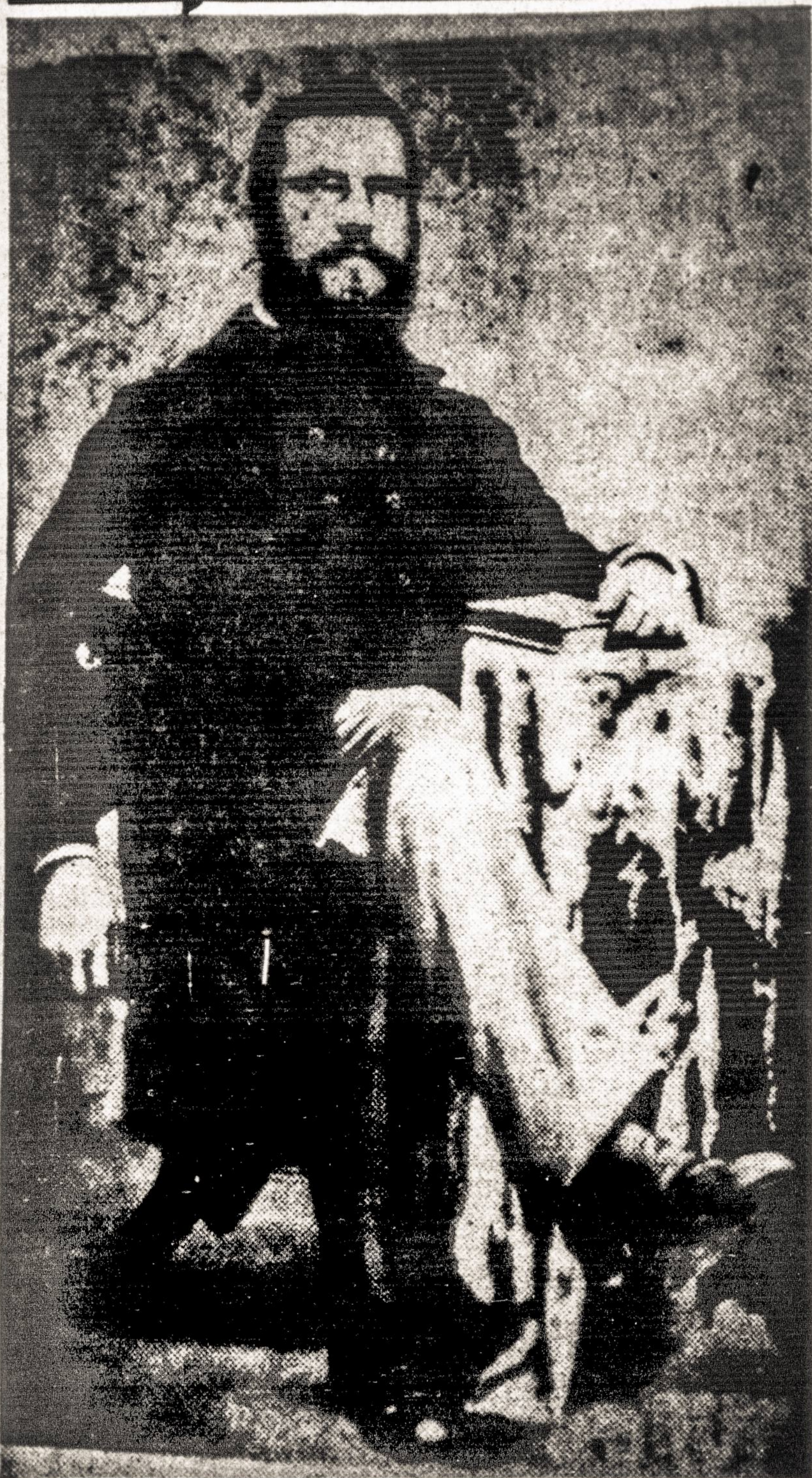
88 m. SLA sukakties Seimas skiriamas 1886 metais SLA įsteigėjo dr. Jono Šliūpo garbei. Seimas įvyks liepos-July 1-4 dienomis Boston, Mass.

Gyvendamas organizavo lietuvius į vieną galingą visų Susivienijimą Lietuvių Amerikoje New Yorke, angliakasių rajone - Plymouth, Wilkes Barre apylinkėse, Pensilvanijoje, Baltimore, Md. Lietuviams padėjo: Lietuvai išsilaivinti, lietuvius suvienijo ir Amerikoje. Šliūpas dalyvavo daugely ir tarptautinių atstovų suvažiavimų, atstovaudamas tai Lietuvos tai Amerikos lietuviams. Amerikoje, Chicagoje, jis ir palaidotas.