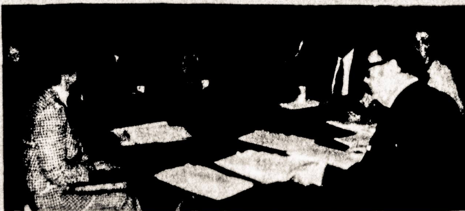
Pildomoji Taryba ir Redakcinė Komisija posėdžio metu