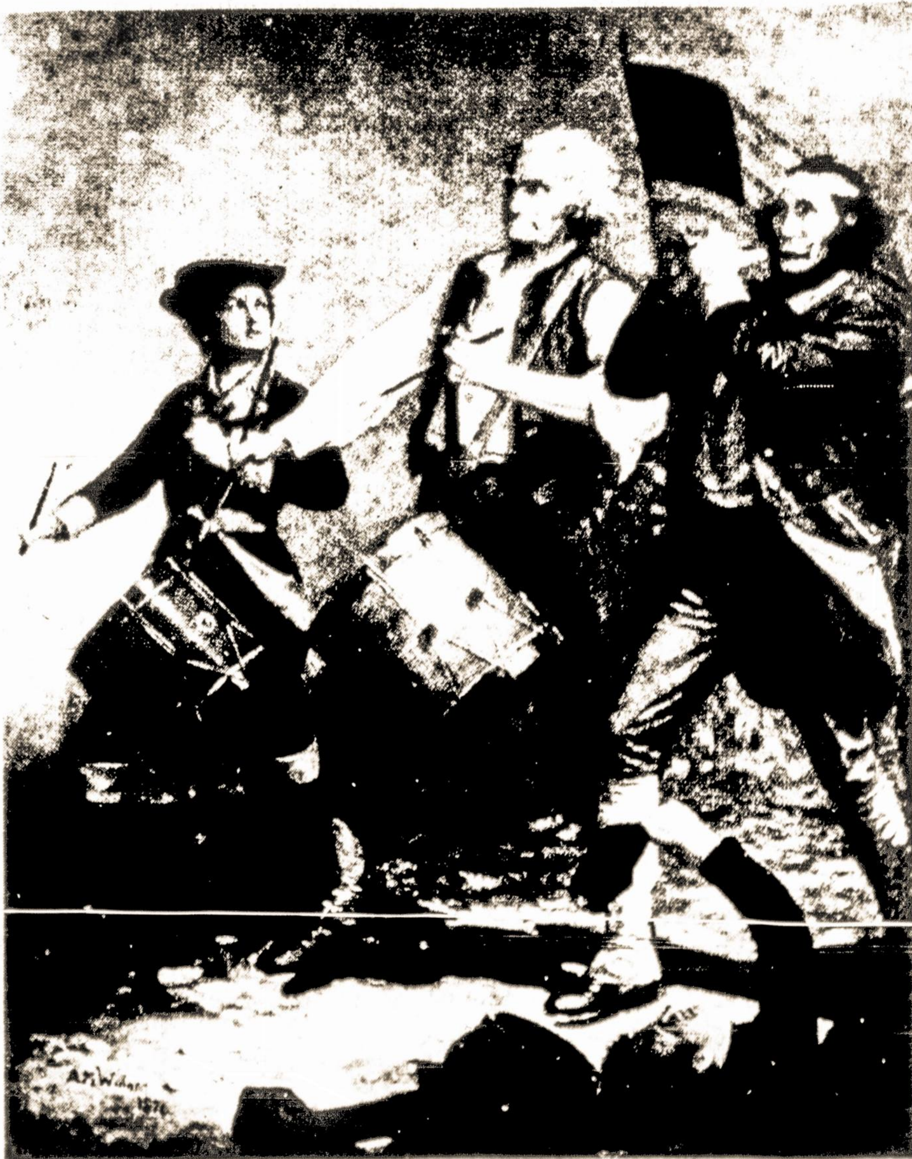
"The Spirit of '76", paveikslas žinomas kiekvienam amerikiečiui. Nutapytas dail. A. M. Willard, šimtmečiui praėjus nuo Nepriklausomybės Deklaracijos pasirašymo.