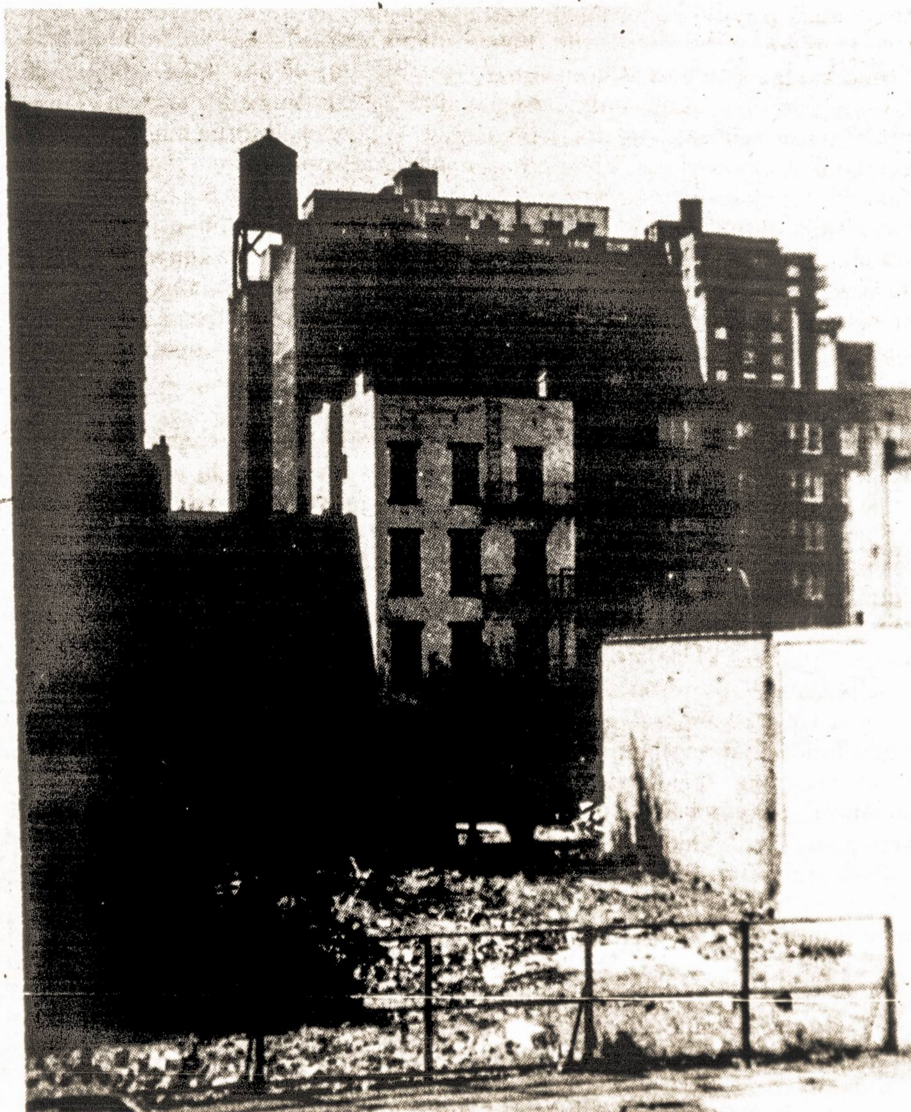
Baltutėlis SLA namas vidury iš kiemo pusės.

Dalyvaudami Kuopų susirinkimuose, iš Finansų Sekretorių atsiimkite S.L.A. Centro pasiūstus nariams išmokos-dividendų čekius. Jei dar neišrinkote delegatų į S.L.A. 59-ąjį Seimą, įvyksiantį lie-