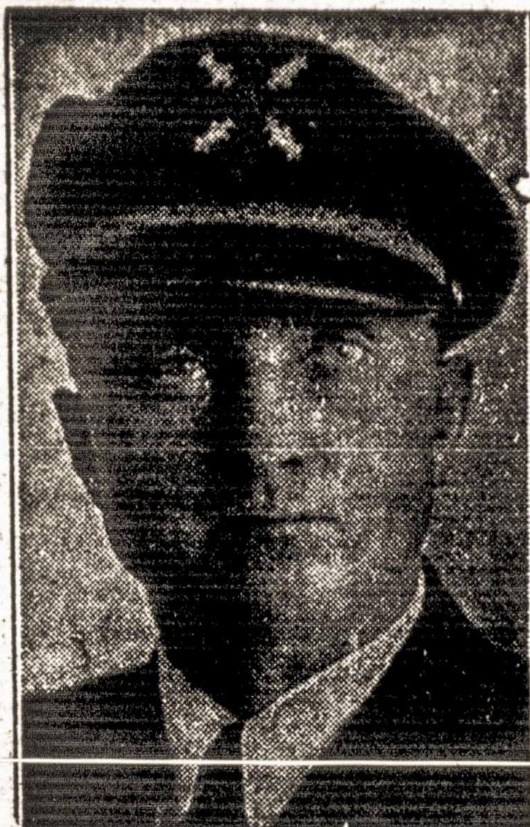
Kap. Stepas Darius