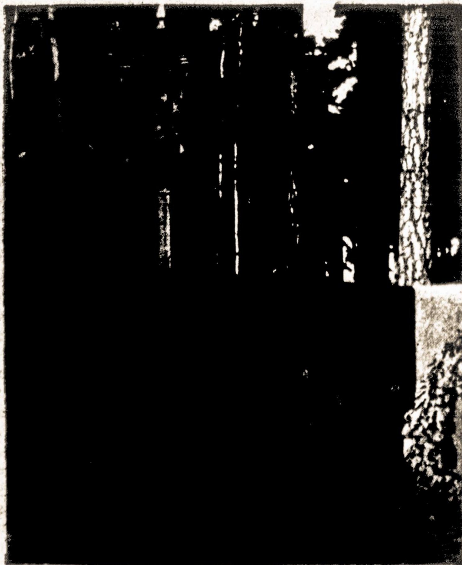
Darius ir Girėno paminklas jų tragiško žuvimo vietoje Soldino miškelyje. Šį paminklą atremontavo ir globoja Vroclavo lietuviai Lenkijoje.