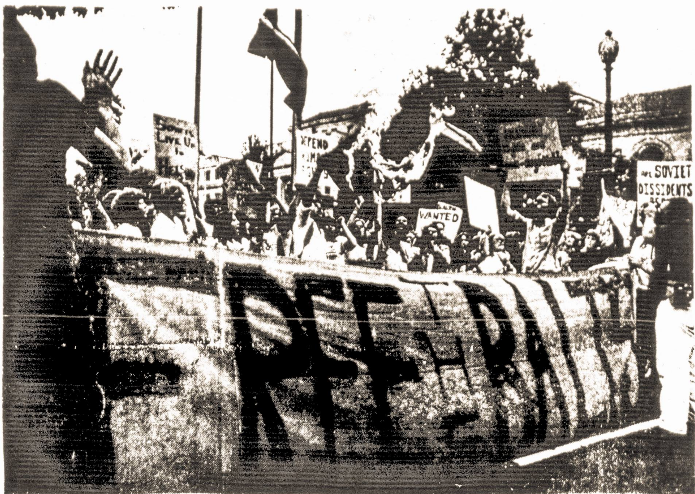
Demonstracijų nuotraukos J. Bilmanio