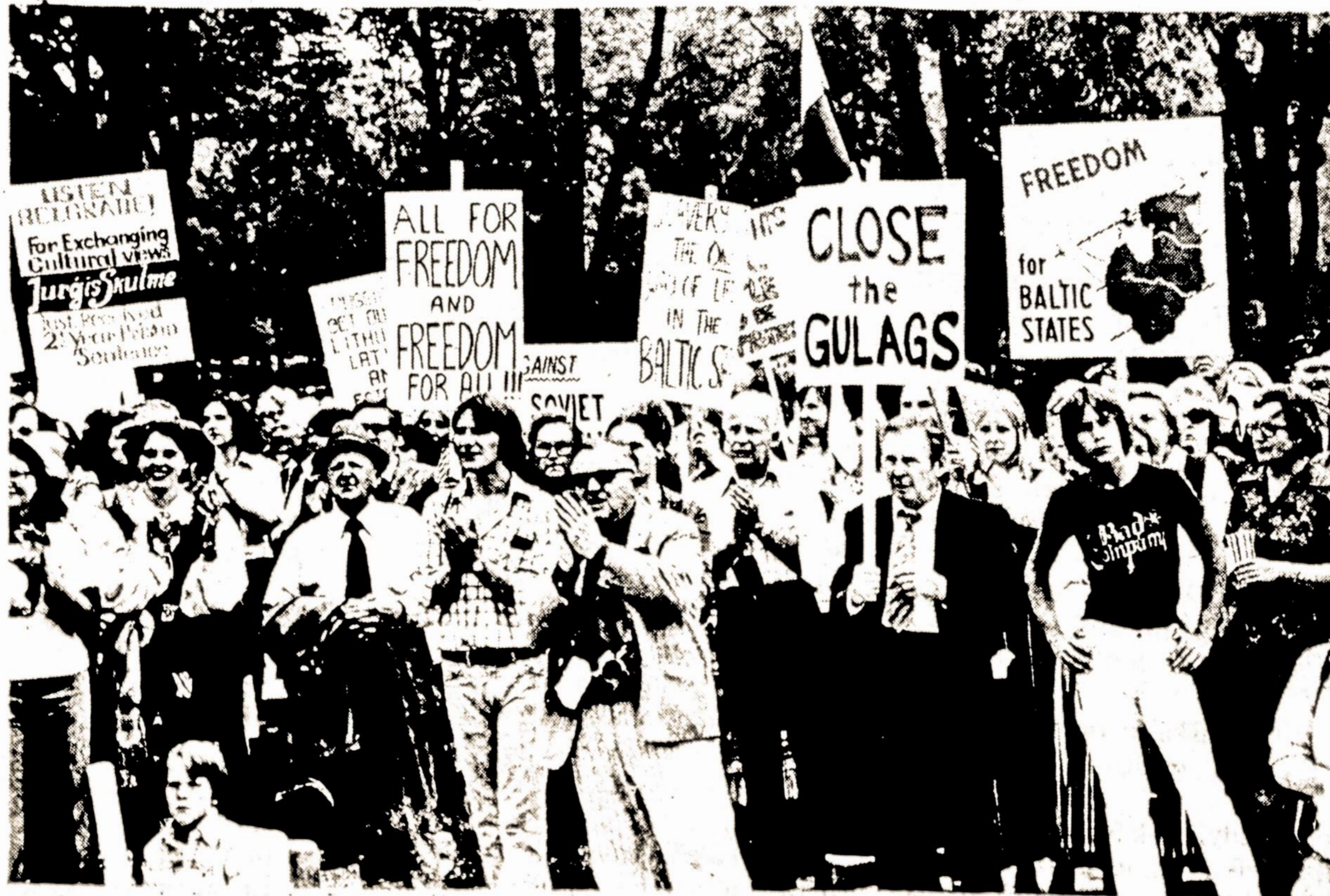
Pabaltiečiai Washingtone nesiojo šimtus plakaty, iškabų, JAV, Lietuvos, Latvijos ir Estijos vėliavų, reikalaujančių išlaisvinti Pabaltijo valstybes.

Egiptas ir Sudanas išpėjo apie sovietų pavoju Afrikai. Atsiliepė ir kitos, įskaitant ir Uganda, Afrikos šalys.