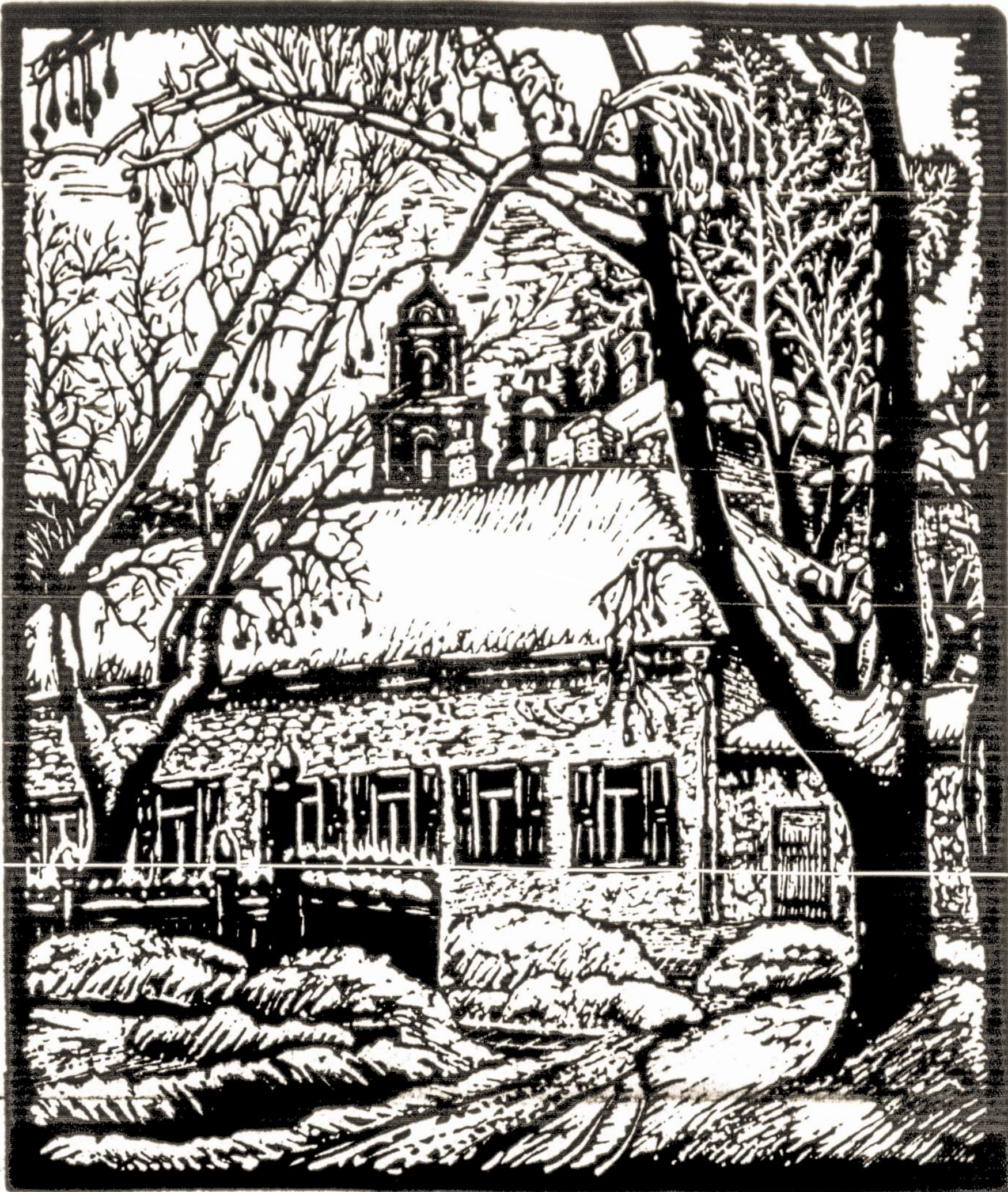
Žiema Vilniuje. Senas kiemas. Už jo matyt Šv. Jono bažnyčios varpinė. Dailininko J. Kuzminsko linoleumo raizyns.

Kiti šių metų pažymėtini darbai buvo SLA 91-erių metų sukakties