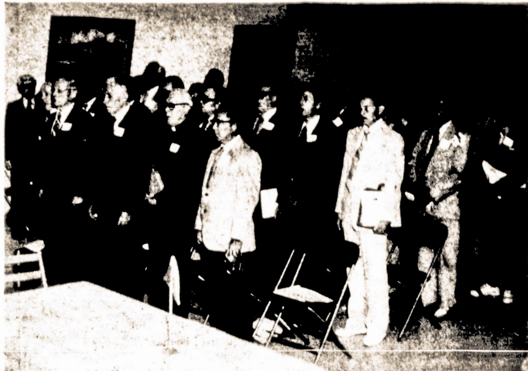
VLIKO Seimo St. Petersburg, Fla. dalyvių nuotrauka.