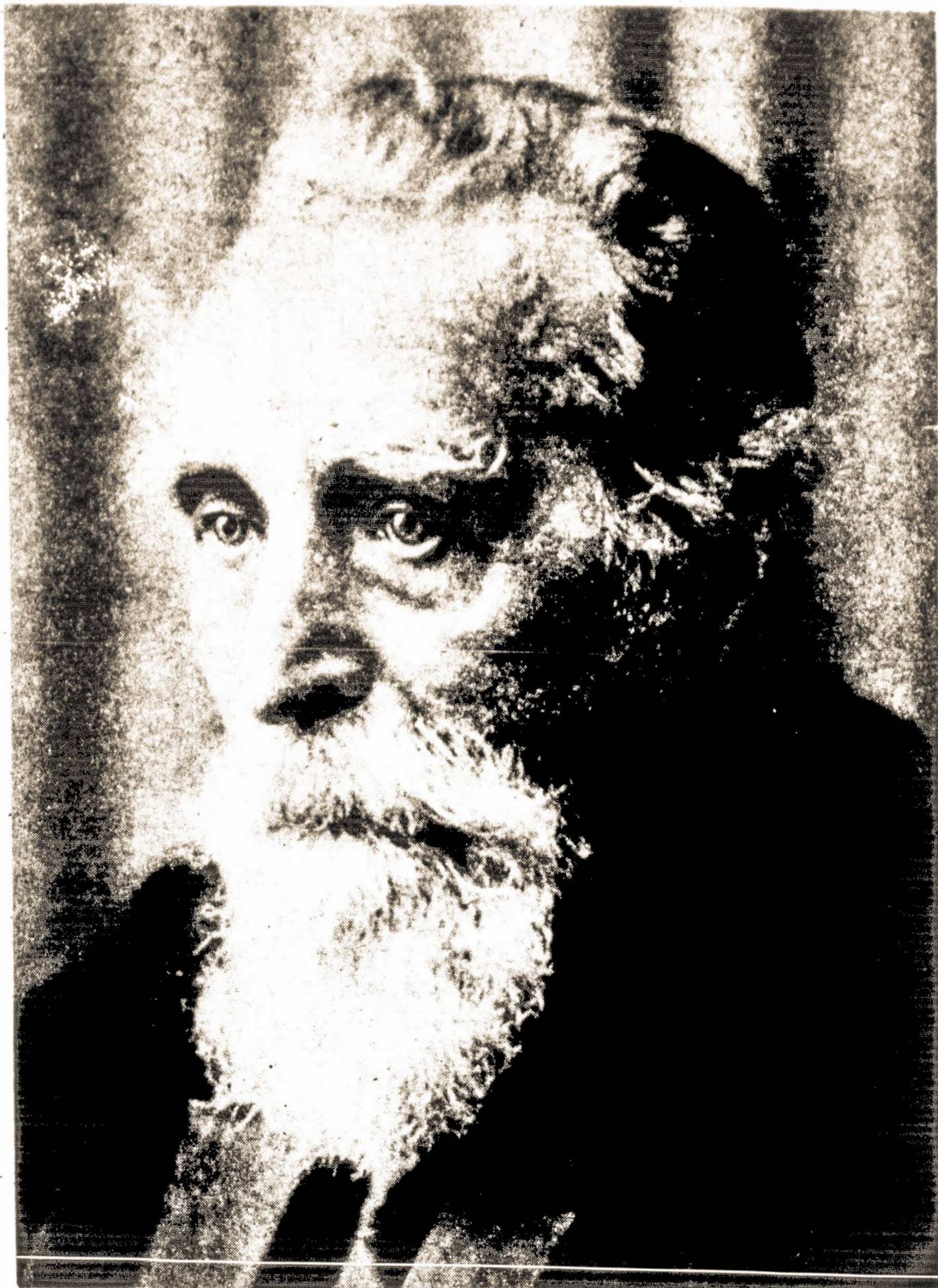
Tautos patriarchas Dr. Jonas Basanavičius.

. . . . Kitas svarbus žygis buvo Amerikos Lietuvių Tarybos suorganizavimas . . . . Šis tarpsprovinis veiksnys atkakliai kovoja ir rūpinasi ne tik lėšų telkimu Lietuvos išlaisvinimo reikalams, bet budi ir daro pastangas