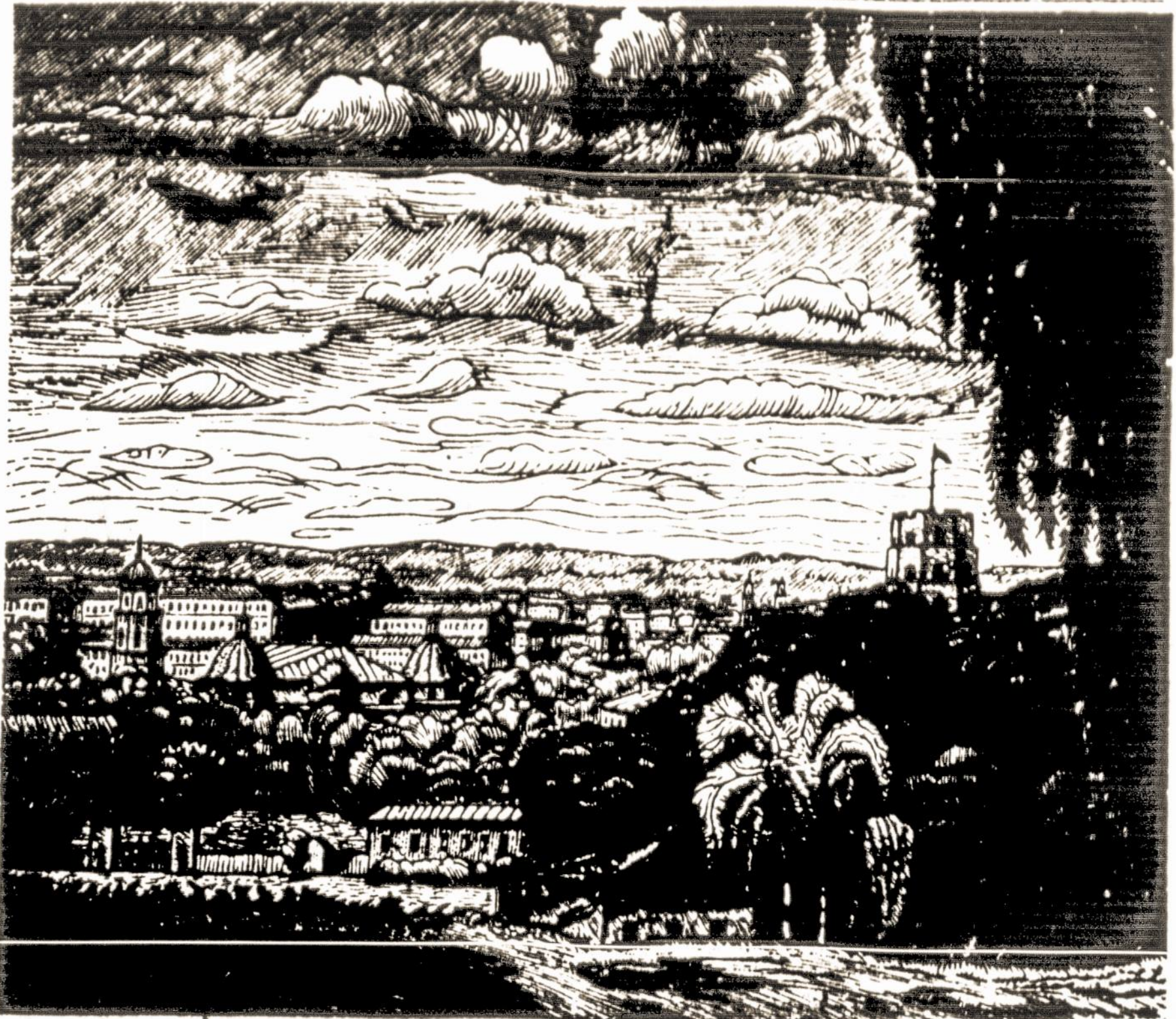
Lietuvos sostinės Vilniaus kur 1918 m. vasario 16 paskelbta Lietuvos nepriklausomybė, panorama su Gedimino pilies bokštu. Dail. J. Kuzminskio medžio raižinys.