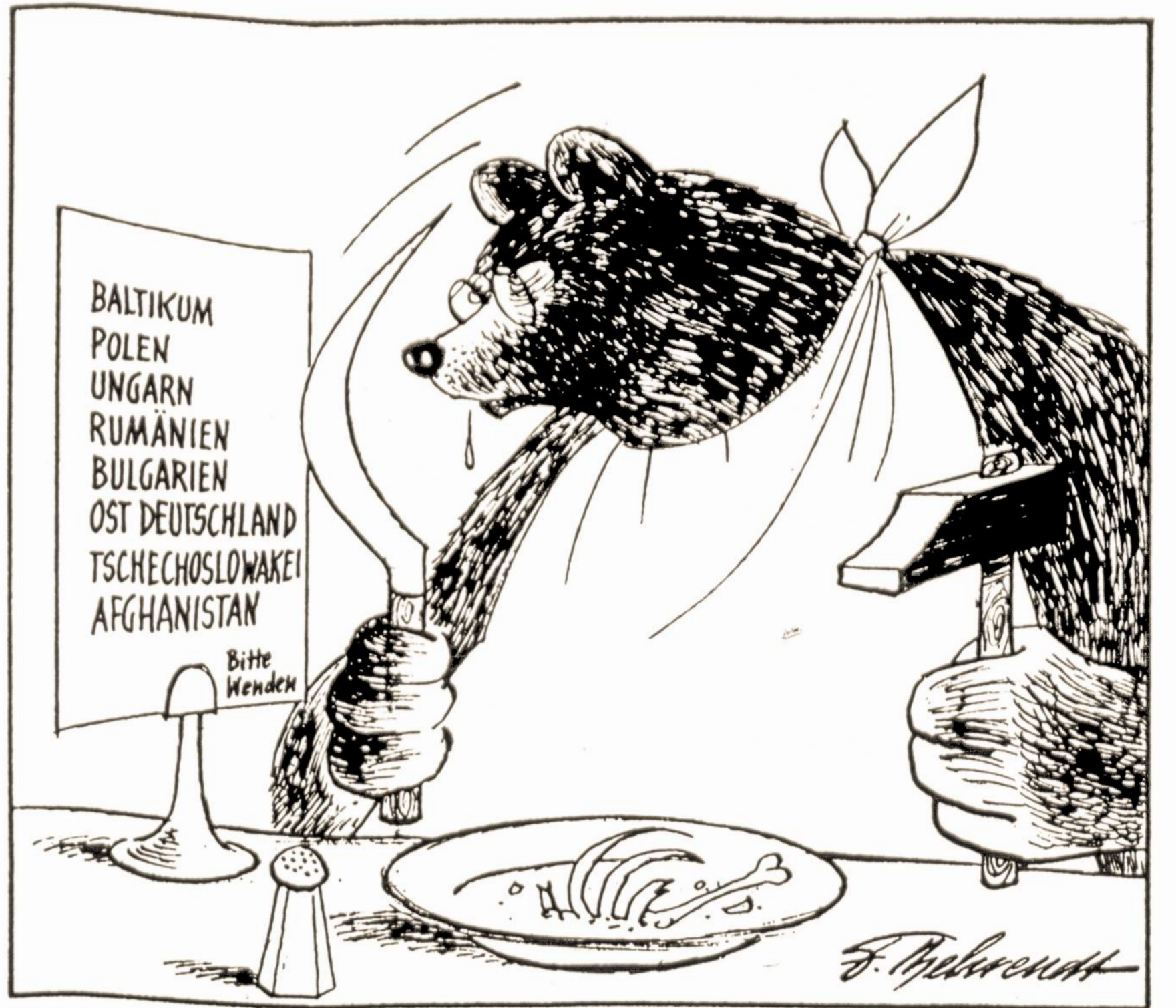
Vokiečių Frankfurter Allgemeine Zeitung geriausiai apibūdino Afganistano okupaciją.