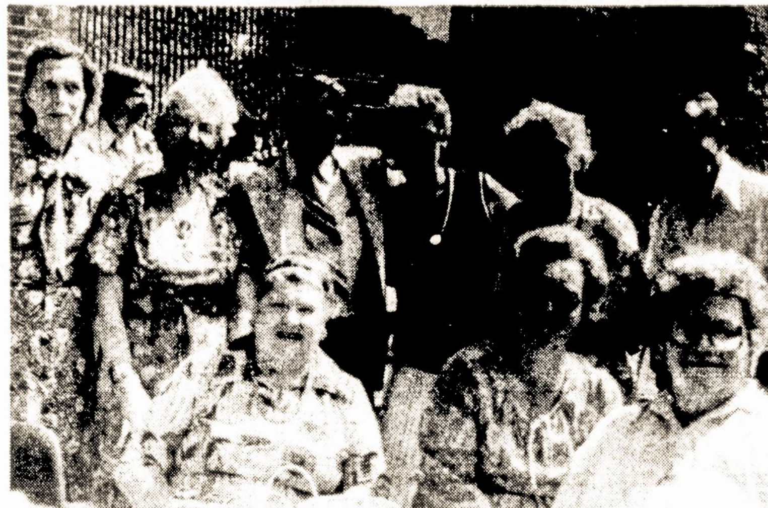
Ir atostogaudami bei piknikaudami New Yorko lietuviai SLA nariai pasikalba apie SLA vaju.