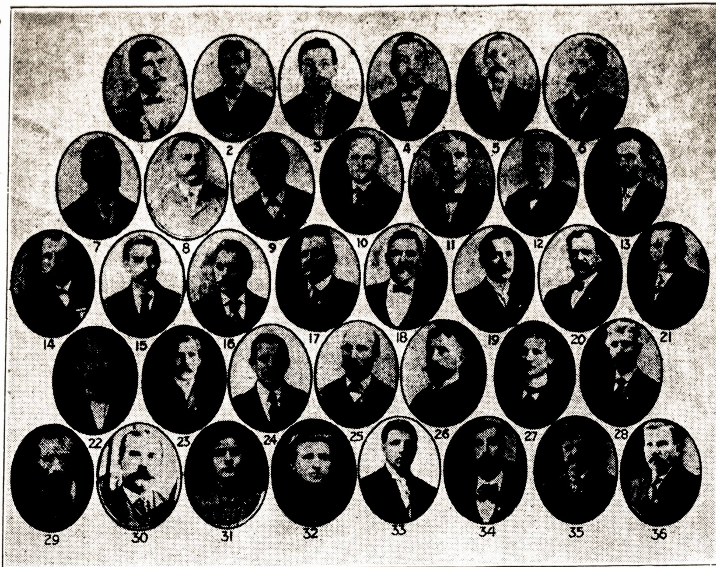
Lithuanian Alliance of America—Historic Convention of 1901 took place in Wilkes Barre, Pa.