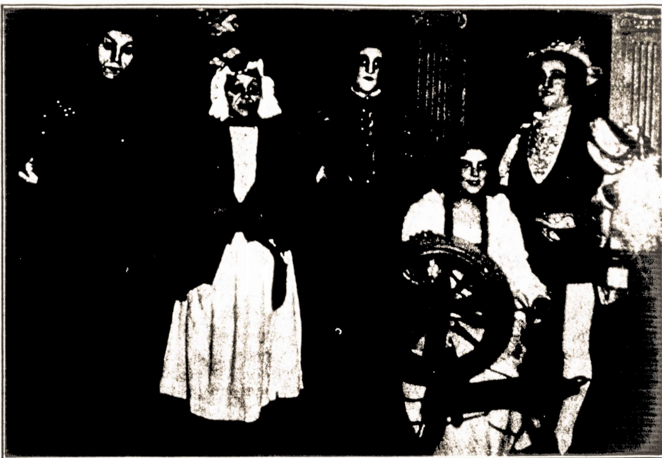
The actors from Brooklyn lodge, N. Y., 38 organized and acted out a few scenes from the opera "Faust" at 37th convention which was held at Pittsburgh, Pa. in 1932.