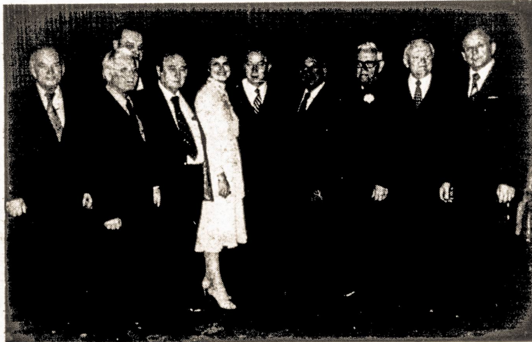
ALTO naujoji Centro Valdyba.