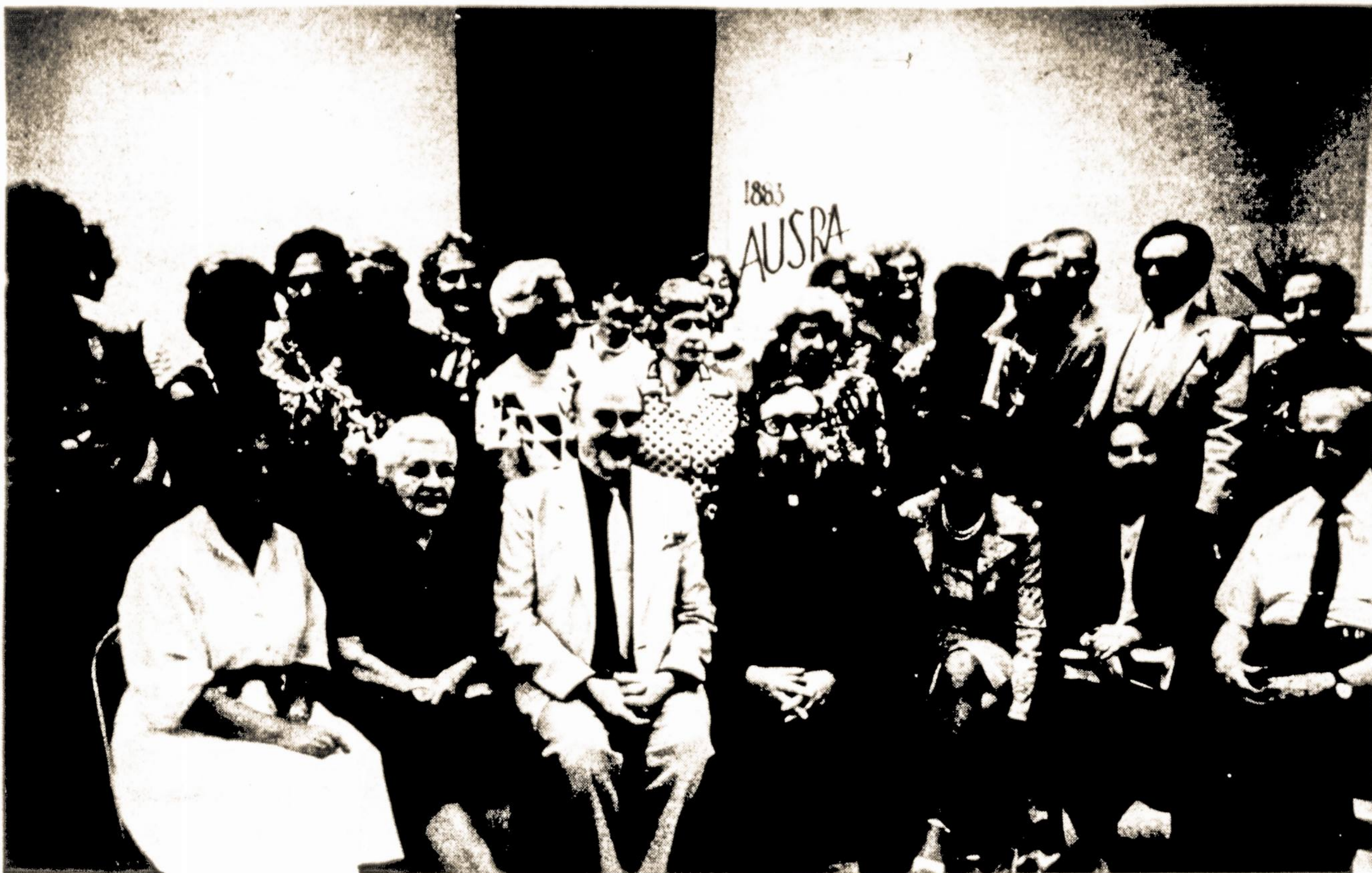
Dalis newyorkiečių, dalyvavusių SLA Centro patalpoje New Yorke birželio 19 d. 126 centrinės kuopos ir Moterų 99 kuopos surengtame Aušros 100 metų minėjime. Pirmoje eilėje iš k. į d.: SLA sekretorė