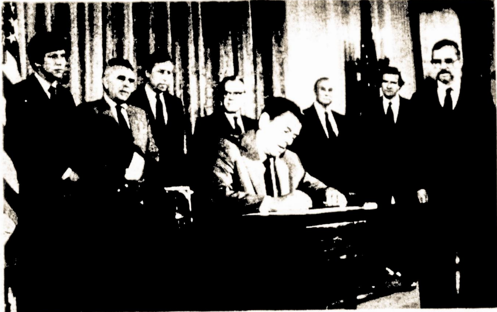
Prezidentas Reagan pasirašė Baltic Freedom Day proklamaciją Baltuosiuose Rūmuose, dalyvaujant pabaltiečių veikėjams ir svečiams.