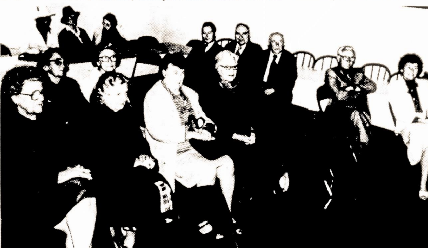
SLA 6-osios apskrities metinės konferencijos, įvykusios rugsėjo 25 d. Chicagos Lietuvių Evangelikų Reformatų parapijos patalpose, dalyvių dalis.