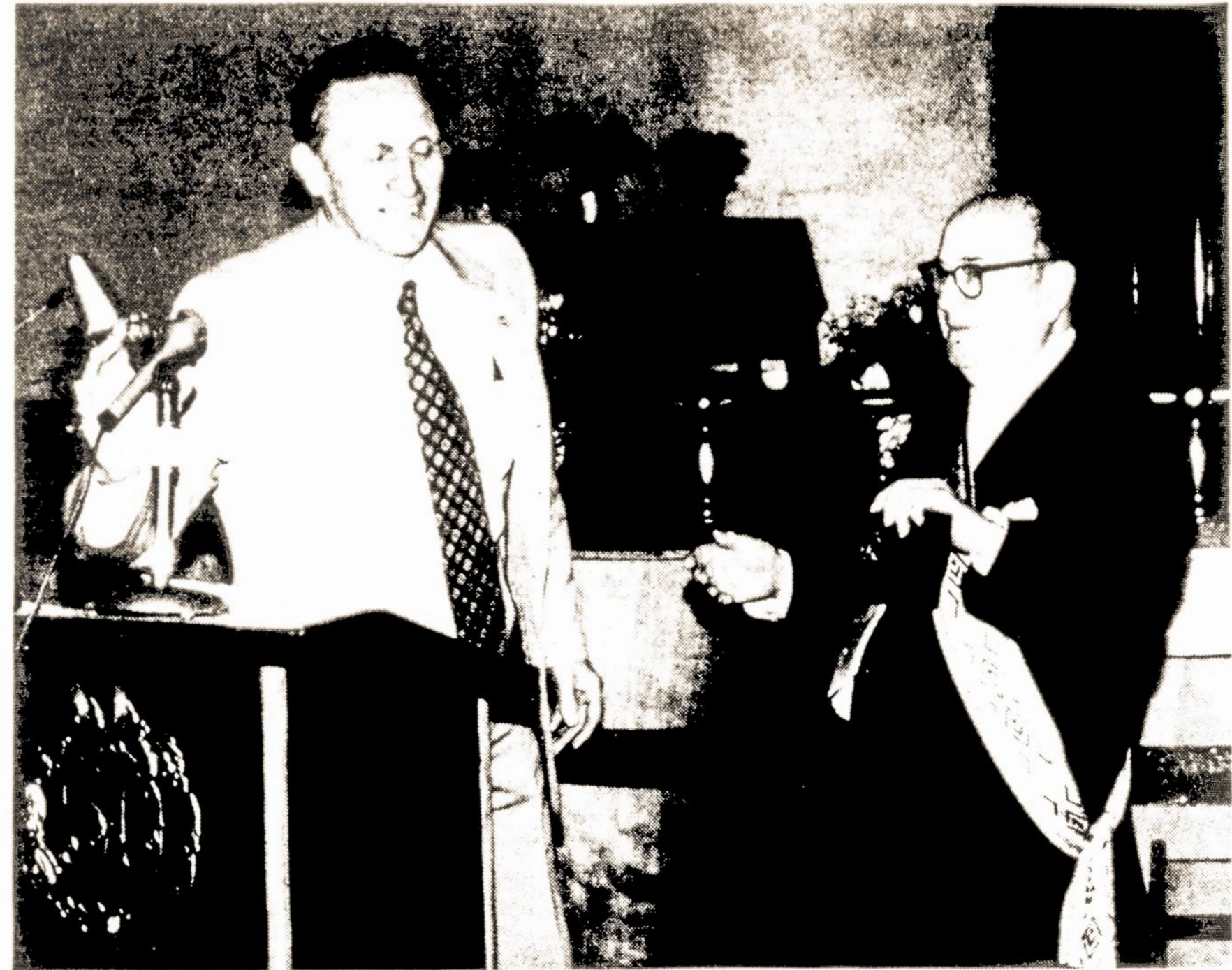
Sherifas Povilui Dargiui įteikia "Honorary Sheriff's Badge"