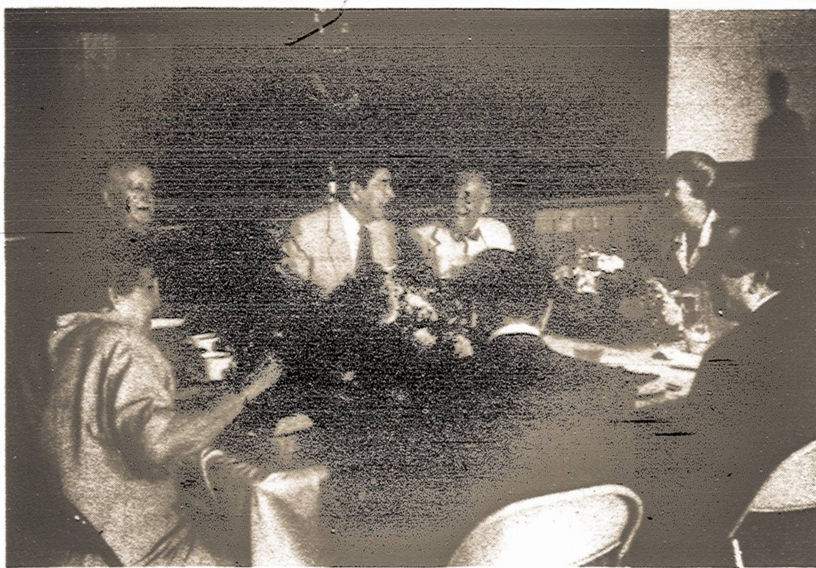
USA President Ronald Reagan with a group of Ethnic groups.