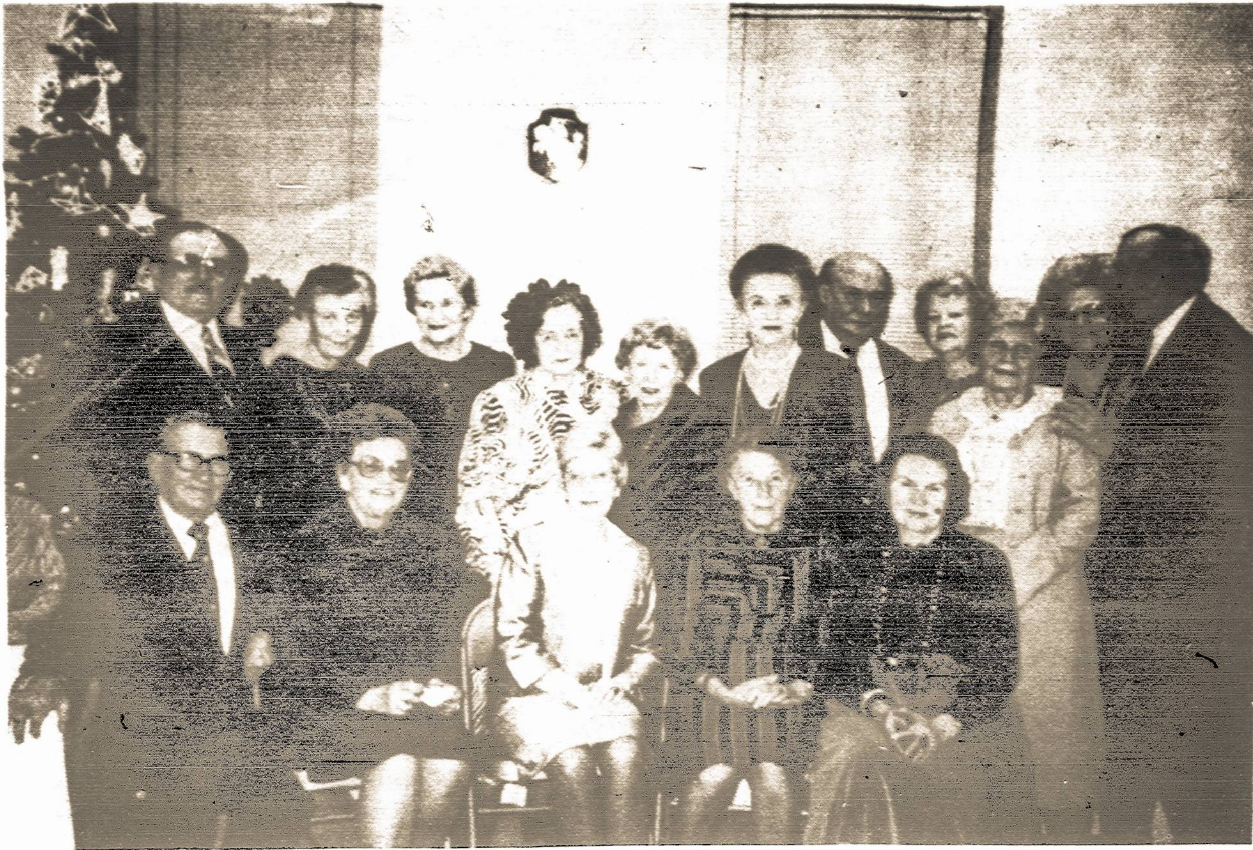
Per daugelį metų SLA Centre prie Kalėdinės Eglutės besivaisinant susirinkdavo pilnutėlė salė SLA narių ir kitų draugijų atstovų, taipogi ir nenarių, kurie vėliau

įsirašydavo į SLA. Toks susirinkimas buvo ir šįmet surengtas 99-tos Moterų Kuopos.