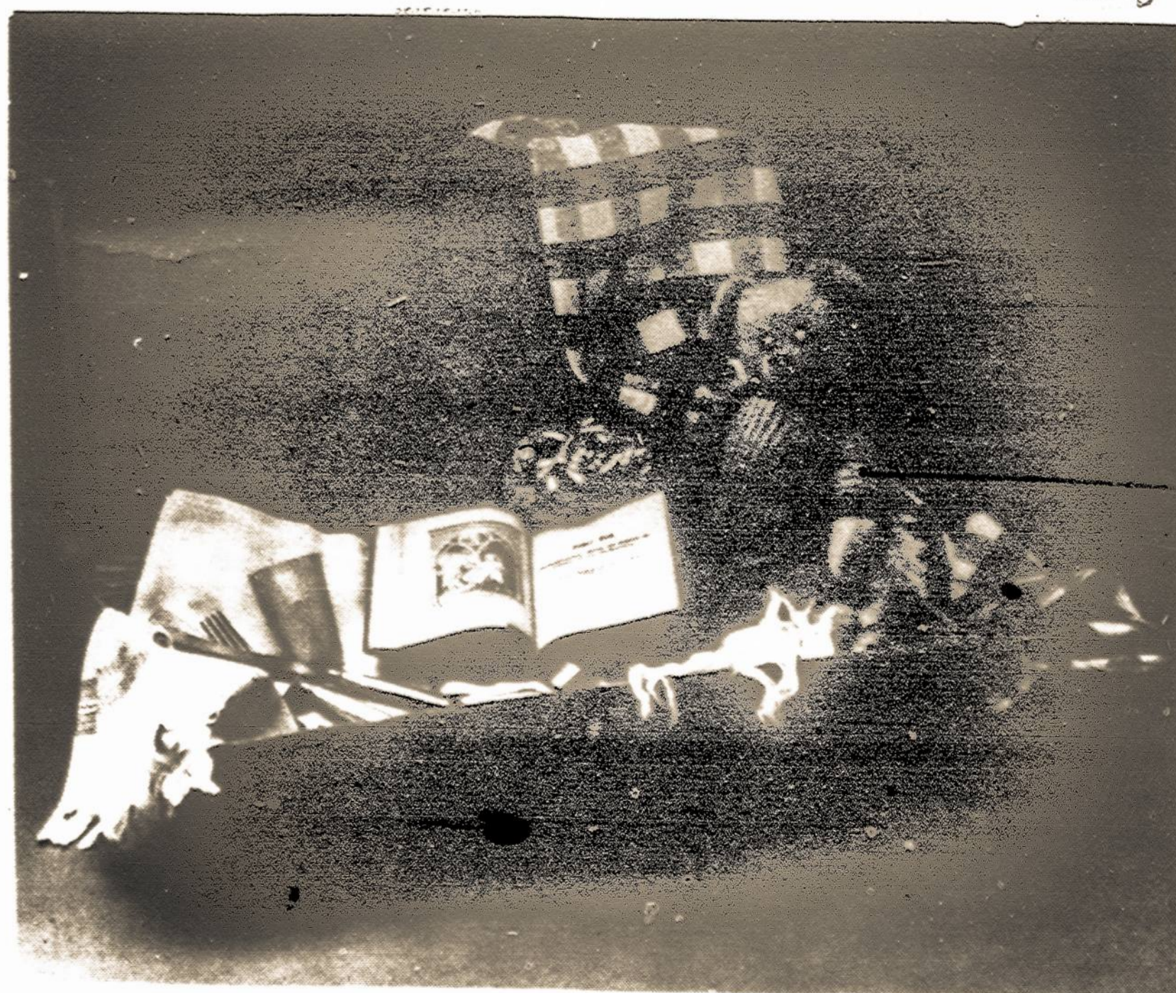
TEVYNĖ, 1987 m. gruodžio-December mėn.