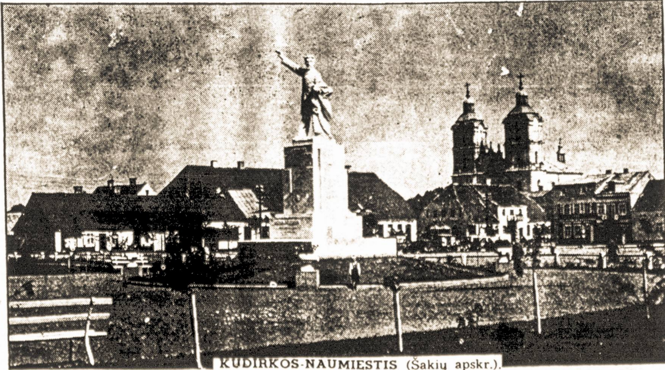
KUDIRKOS-NAUMIESTIS (Šakių apskr.)