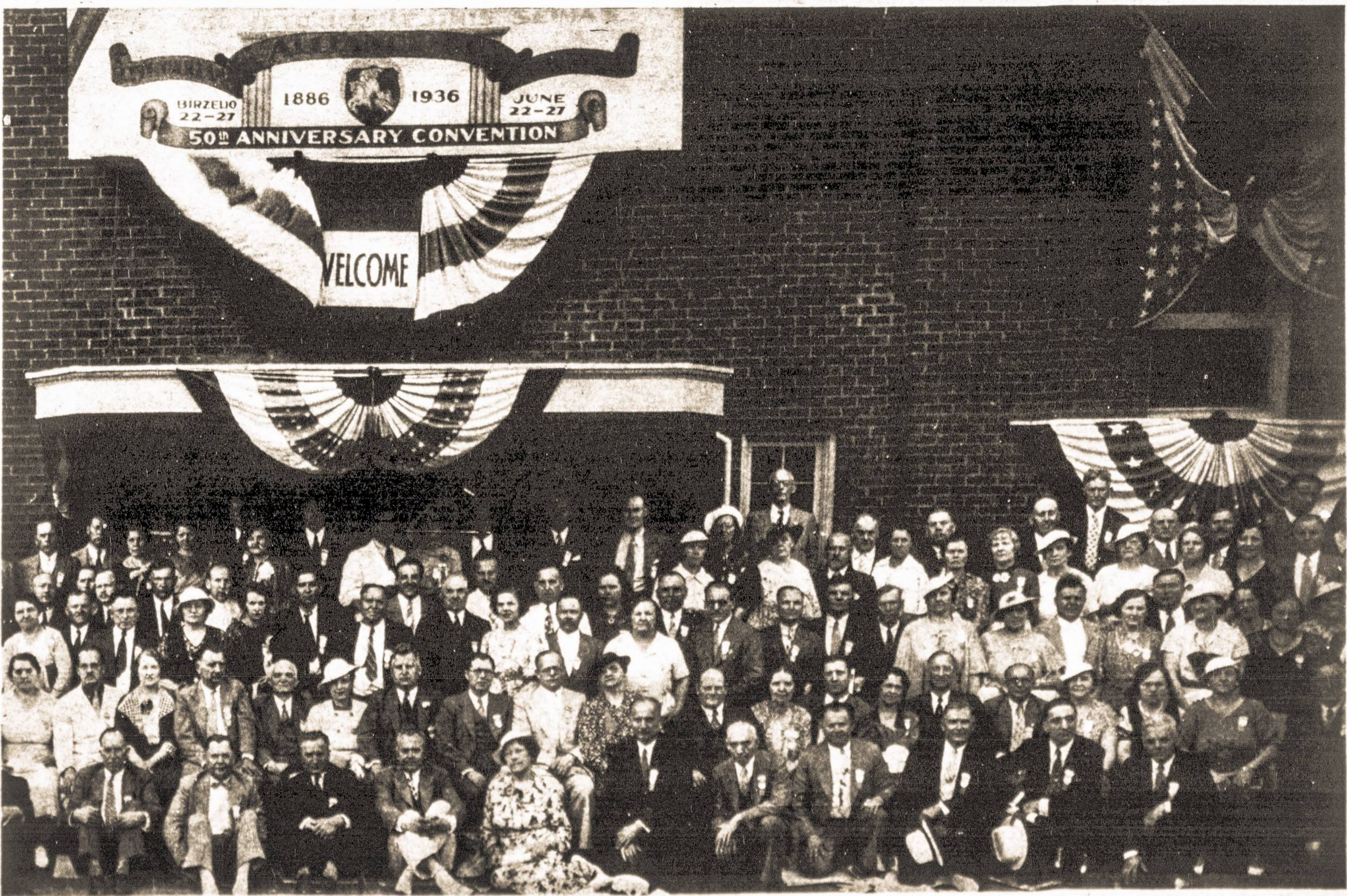
SLA. 39-TO JUBILIEJINIO SEIMO, ĮVYKUSIO BIRŽELIO 22—27 DIENOMIS, 1936 M., CLEVELAND, OHIO, DELEGATAI. (Antroji Dalis) TĖVYNĖ, 1989 m. gegužės-May mėn.