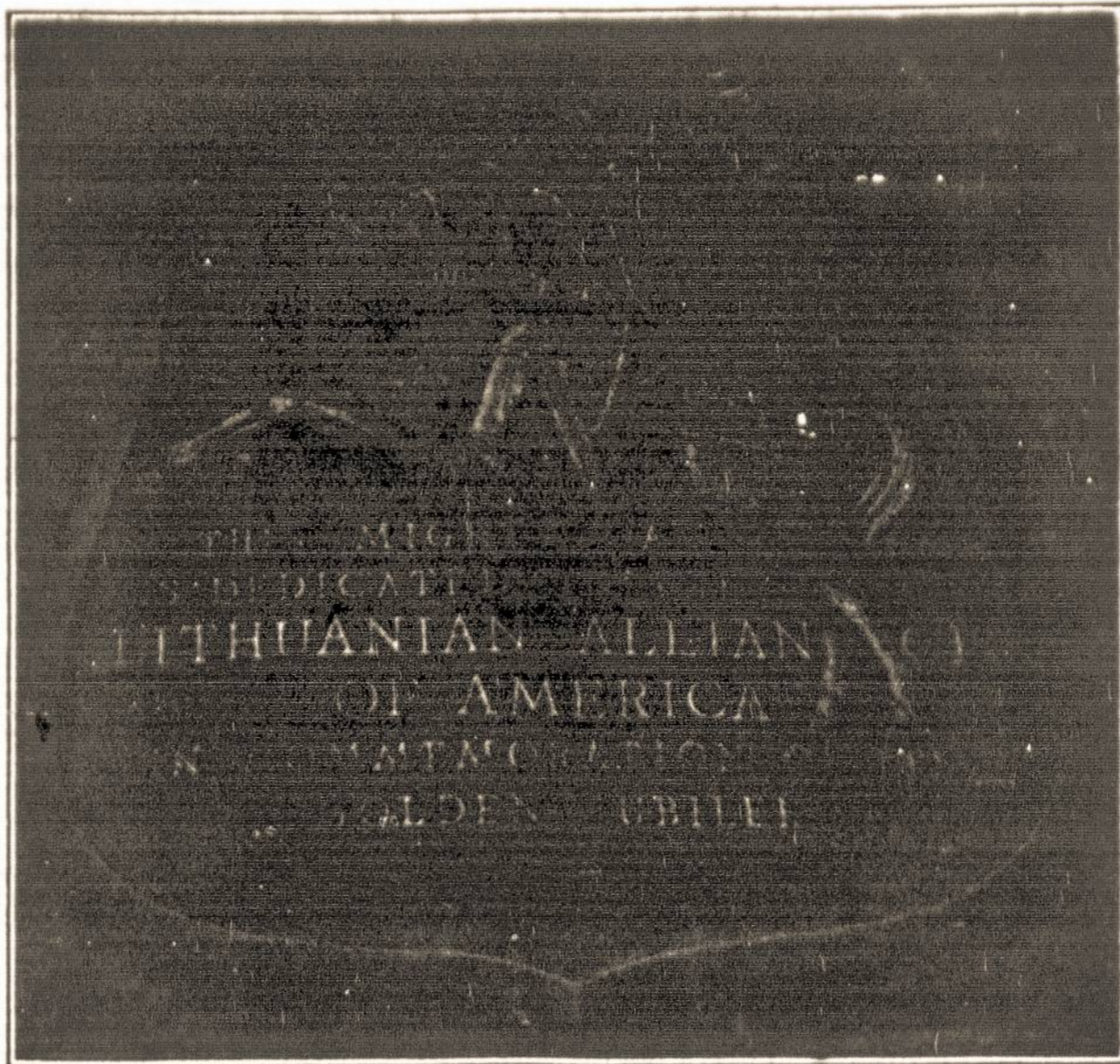
ŽALVARINĖ IŠKABA PRIE SLA. MEDŽIO Clevelando Lietuvių Kultūros Darželyje, kuriame Susivienijimas yra įamžintas.

Prisimenant SLA Jubiliejinio 39-ojo Seimo 1936 m. Cleveland, Ohio veikėjus