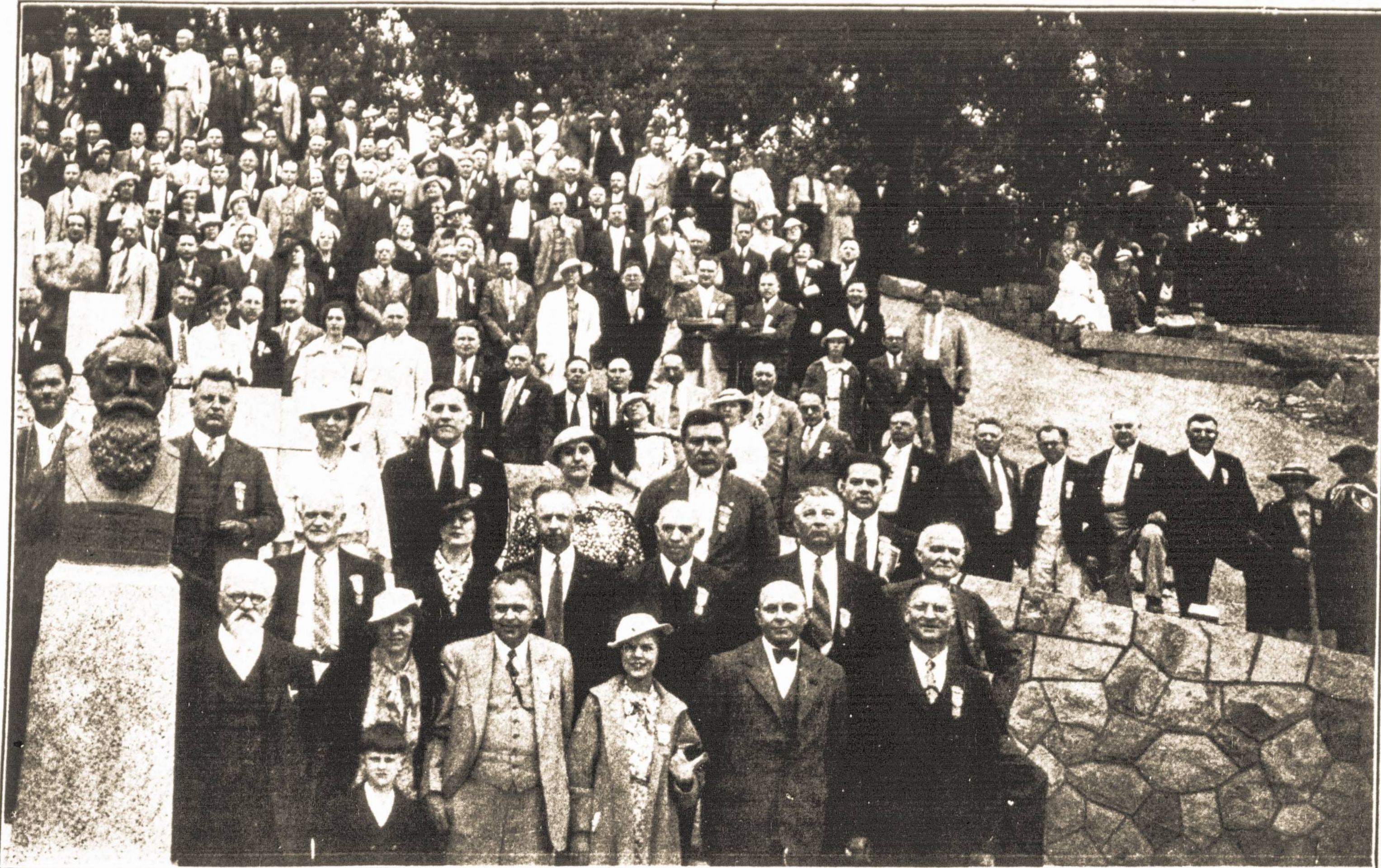
SLA. Jubiliejinio Seimo Metu SLA. Veteranų Pagerbimo Iškilmių Clevelando Lietuvių Kultūros Darželyje Dalyviai. (Antroji Dalis)