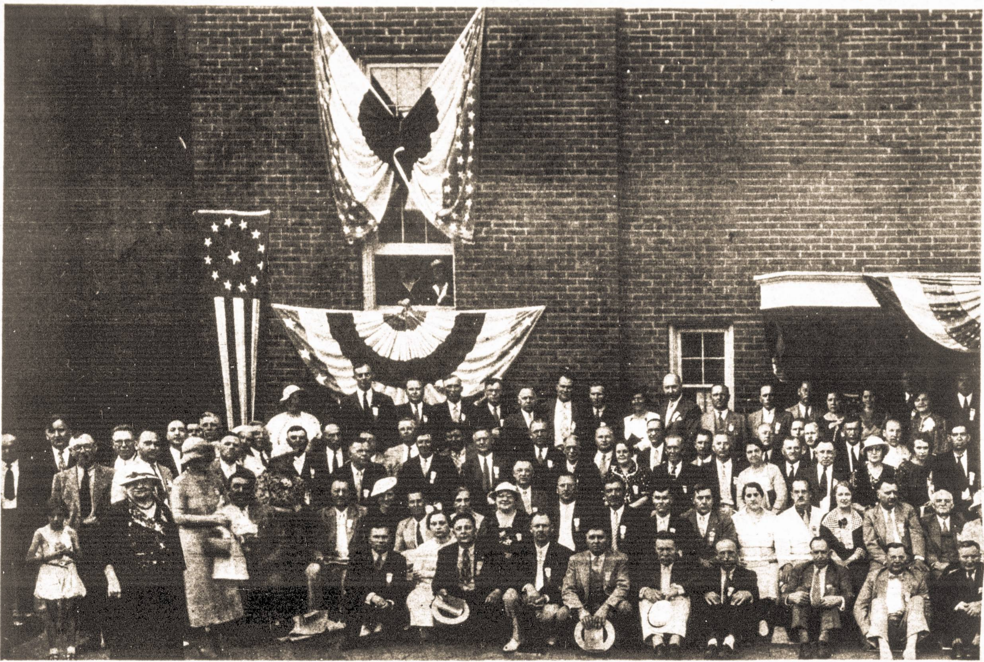
SLA. 39-TO JUBILIEJINIO SEIMO, ĮVYKUSIO BIRŽELIO 22—27 DIENOMIS, 1936 M., CLEVELAND, OHIO, DELEGATAI. (Pirmoji Dalis)

1936 m. gausybę delegatų fotografuoti reikėjo suskirstyti į dvi grupes, kad būtų matomi visi!