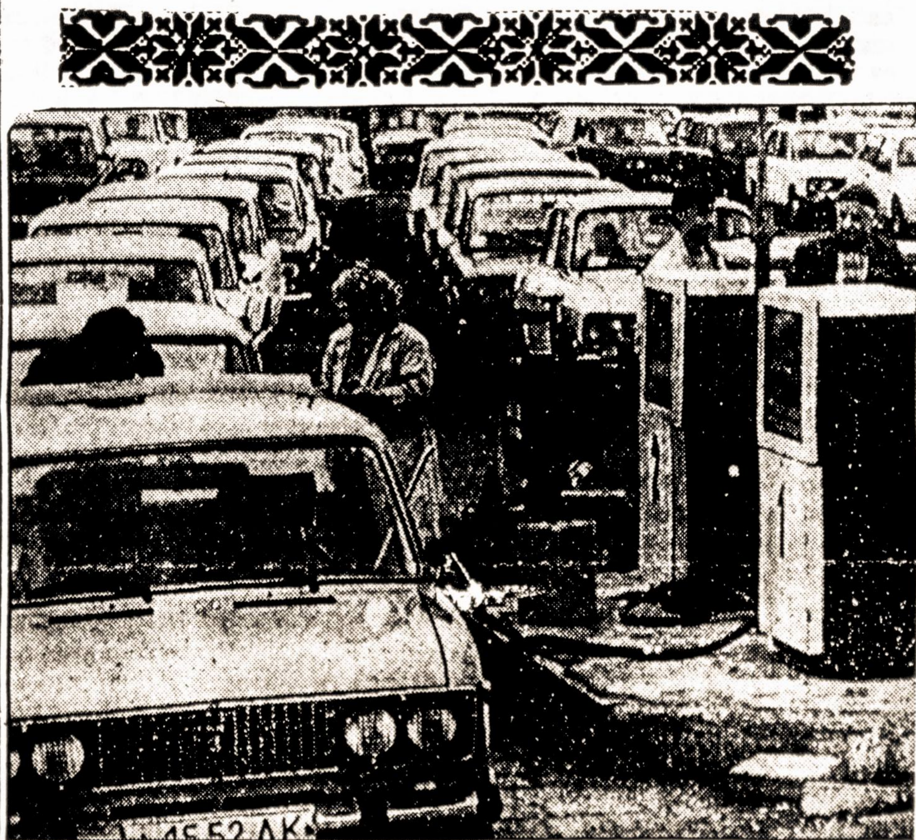
Motorists in Vilnius lined up for gasoline

Nuo 1990 m. pradžios iš viso išmokėta: $20,623.00