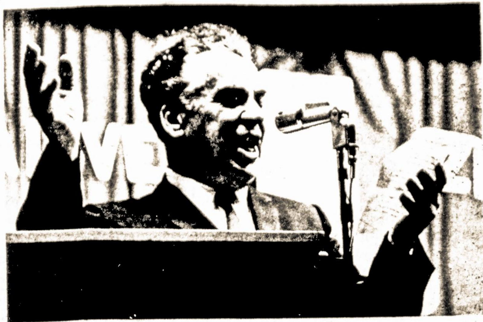
Rugp. 14 d. Boston, Mass. mirė SLA narys, visuomenės veikėjas, poetas, humoristas, kalbėtojas Antanas Gustaitis.