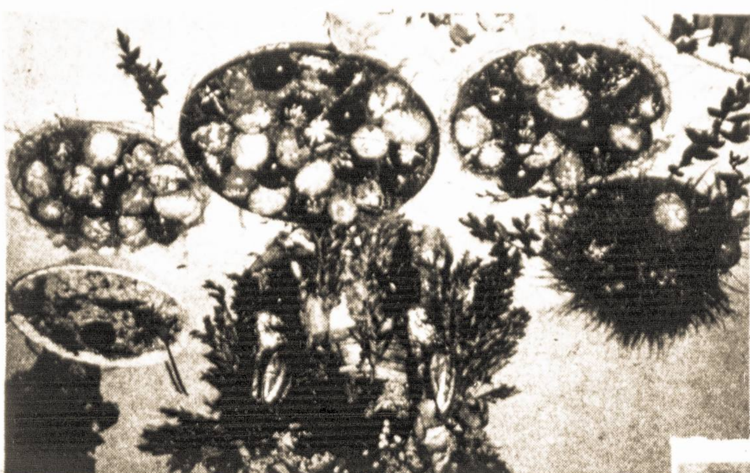
SLA 99-osios Moterų Kuopos 1990 m. balandžio 22 d. suruoštas "Vėlykų Stalas".