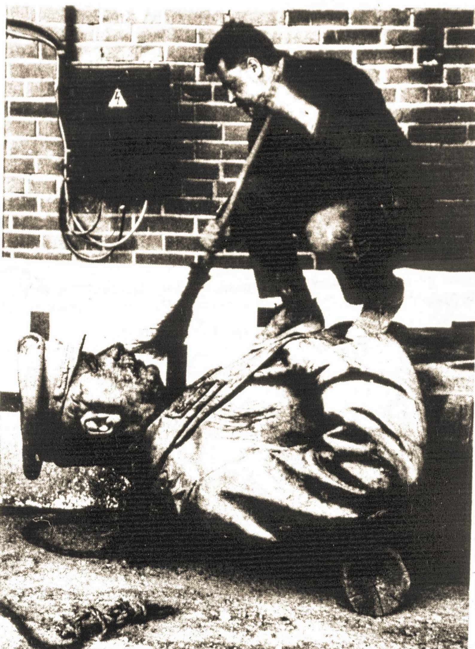
Darbininkas Lietuvoje valo dažais apteptą Stalino statulą, nuimtą nuo pakylės. Tai viena iš daugelio L. C. Price nuotraukų, kuriomis iliustruotas straipsnis apie Baltijos valstybes žurnalo “National Geographic” 1990 m.

Išspausdinti įvairių laikotarpių istoriniai žemėlapiai ir spalvotos Baltijos valstybių vėliavos su trumpais geografiniais aprašais teikia gana išsamią ir teisingą informaciją. Lietuvos teritorijos keitimasis, pradedant XIV š. ir baigiant 1938 m. mažiau susipažinusiems su Lietuvos istorija šalia trumpų paaiškinimų grafiškai ją gerai pavaizduoja. Pridėtas ir paaiškinimas, kad Lietuva buvusi galingiausia baltiečių valstybė su savo pietinėmis sienomis prie Juodųjų jūrų. Po nacių-sovietų pakto 1939 m. baltiečiai vėl pateko po rusų jungu.