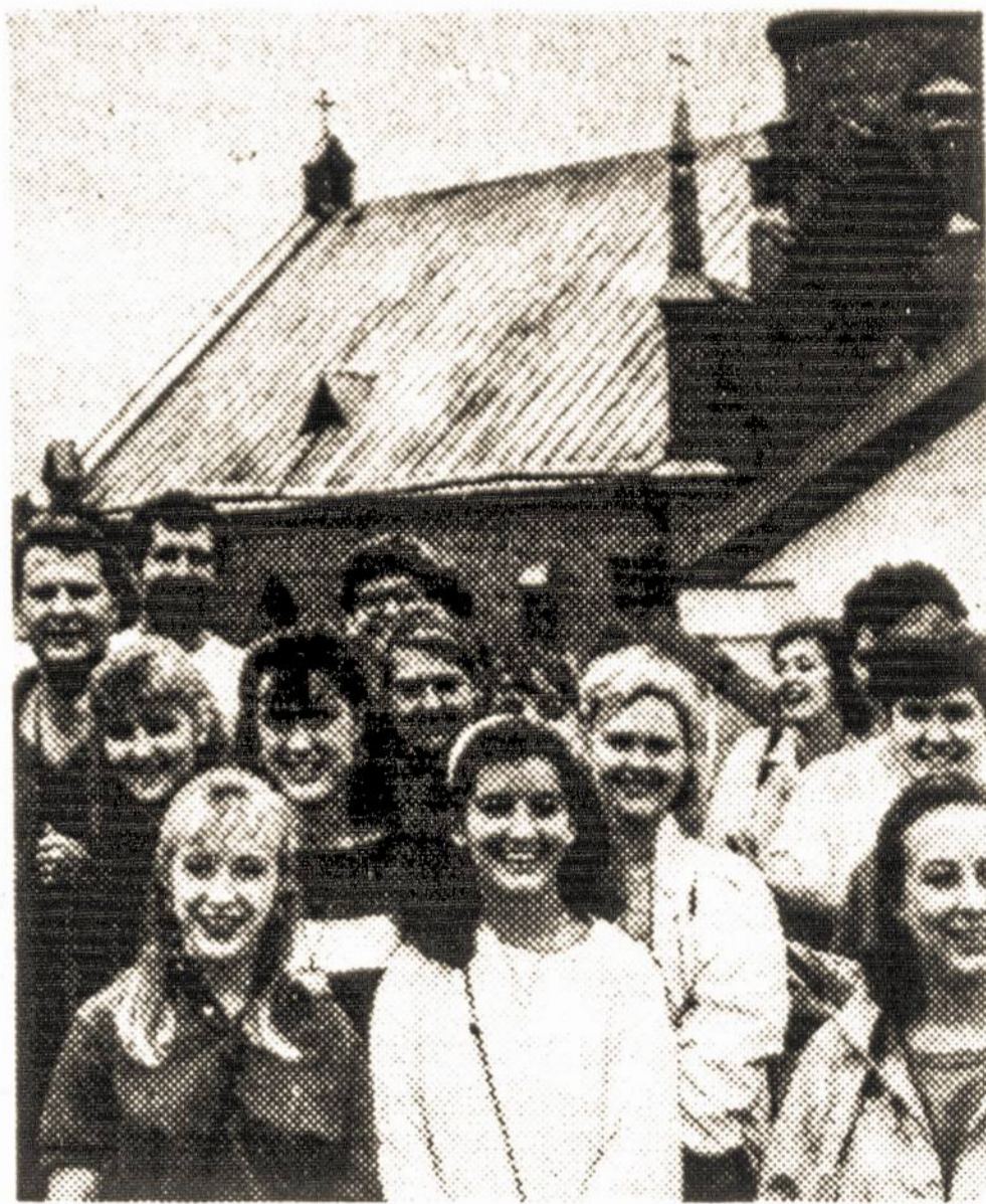
Nuotraukoje: svečiai Kernavėje.

Tolimesnis jų maršrutas – Ryga, Tallinas, Helsinkis.