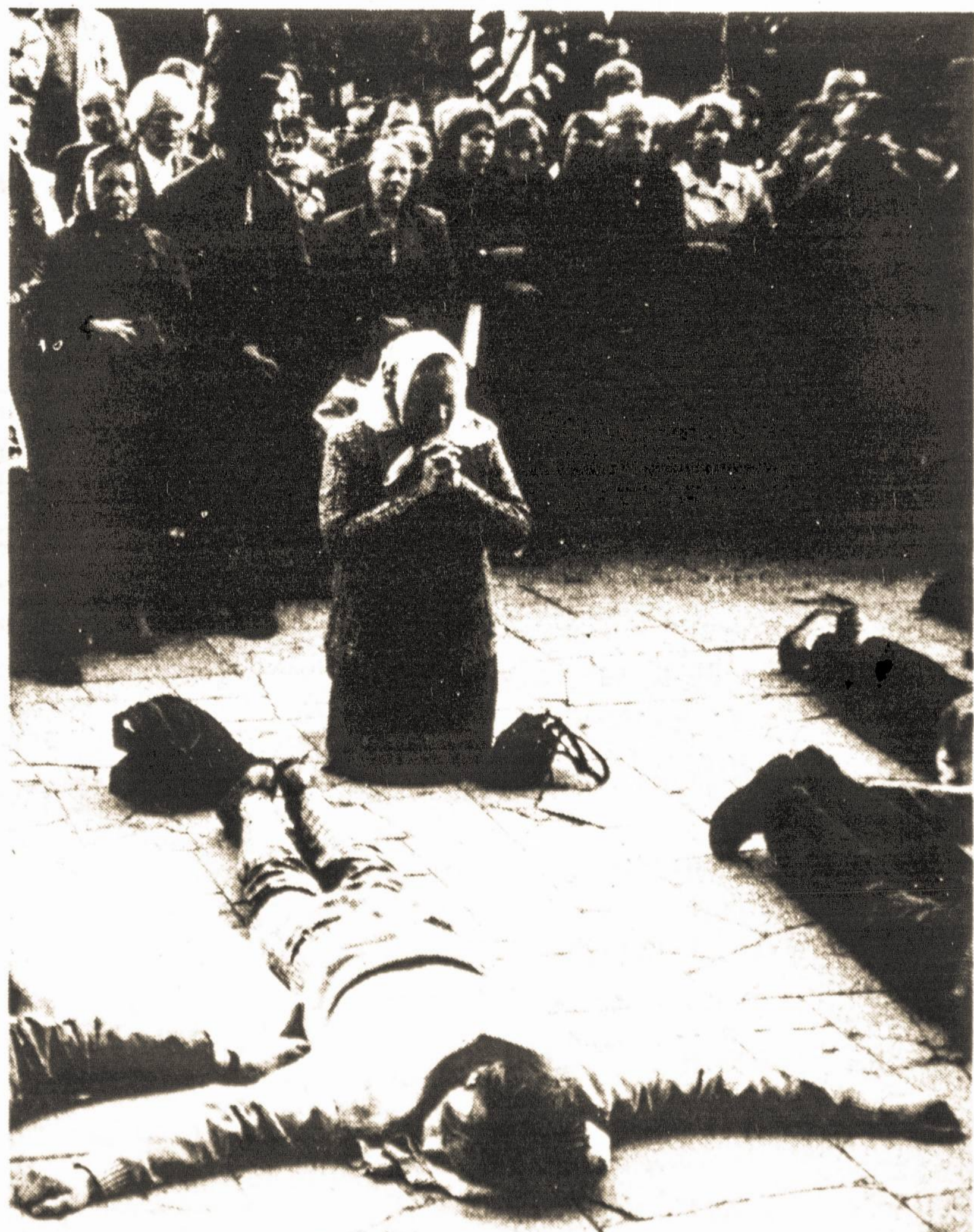
Amerikiečių žurnalas “National Geographic” 1990 m. lapkričio laidoje išspausdino straipsnį apie Baltijos valstybes su gausiomis nuotraukomis. Šioje nuotraukoje matyti badautojai, gulintys kryžiumi aikštėje prie Vilniaus katedros. Tuo būdu jie išreiškia protestą prieš sovietinę vergiją ir lietuvių tautos tikėjimą į Tėvynės prisikėlimą