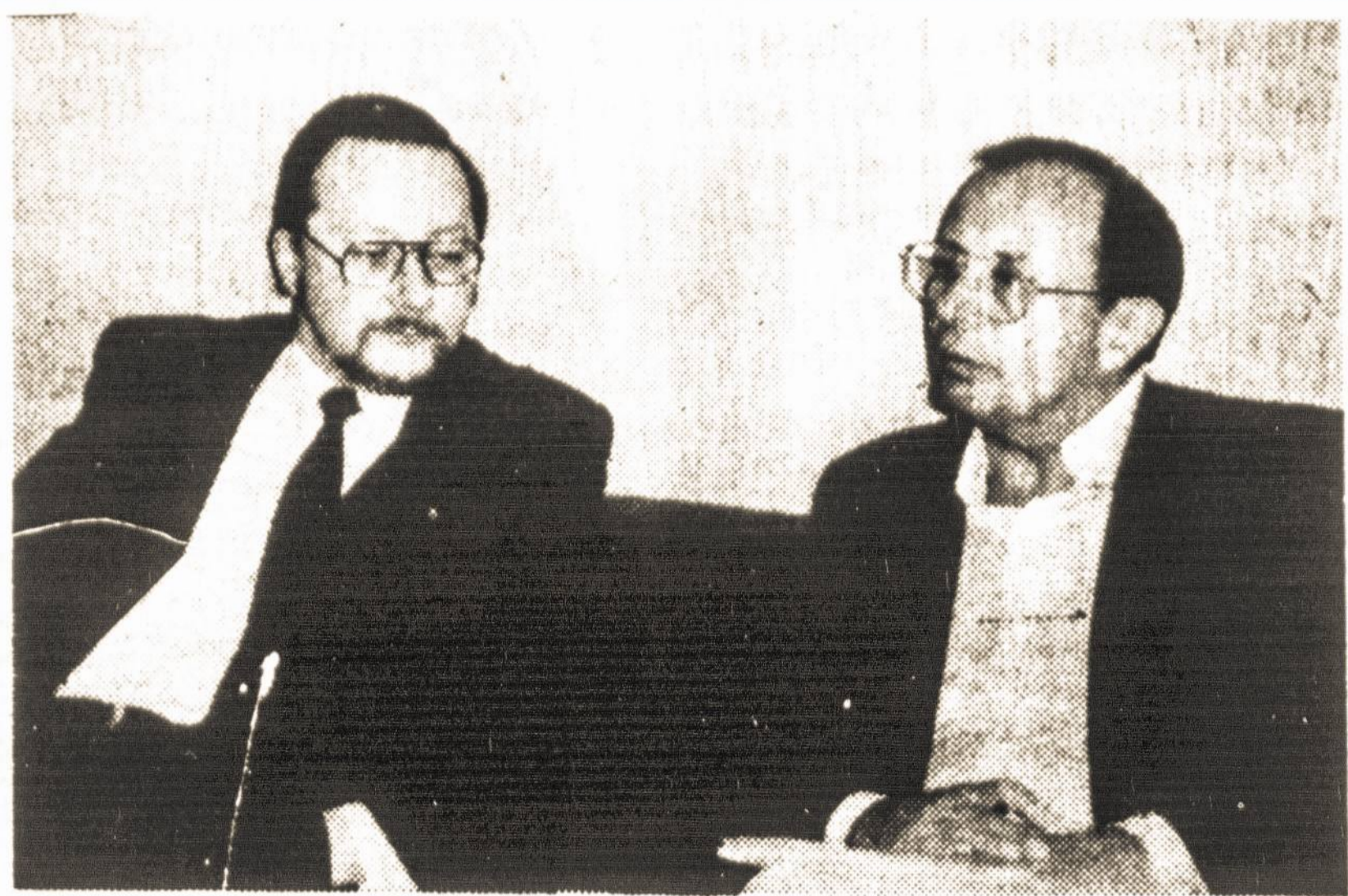
Senatorius Alfonse M. D'Amato (R-NY) Maskvoje tariasi su Lietuvos prezidentu Vytautu Landsbergiu, žmogaus teisių konferencijos metu. V. Landsbergis pakvietė senatorių aplankyti ir Lietuvą.