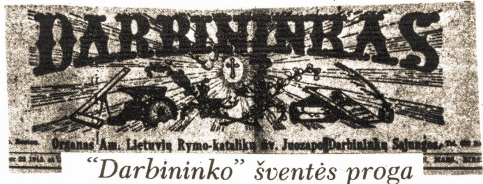
„Darbininko“ šventės proga