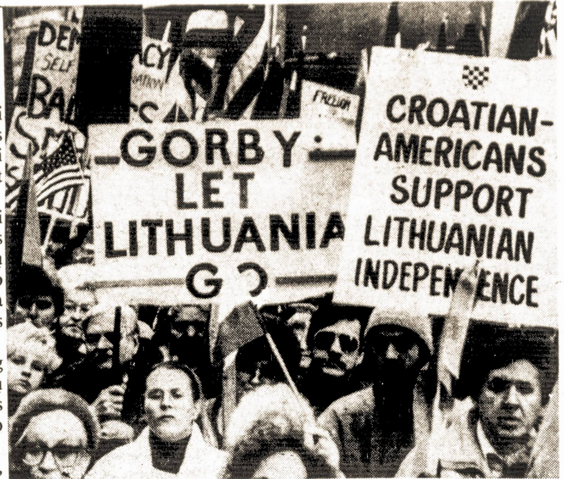
New Yorko lietuviai demonstruoja už Lietuvos laisvę sausio 19 prie Sovietų misijos prie Jungtinių Tautų.

Senatorius D'Amato, yra JAV Helsinkio komisijos narys, paminėjo kad "per penkiasdešimt metų Sovietai nelegaliai laikė Pabaltijo kraštus okupuotus, dabar ir Amerika turi jais rūpintis.