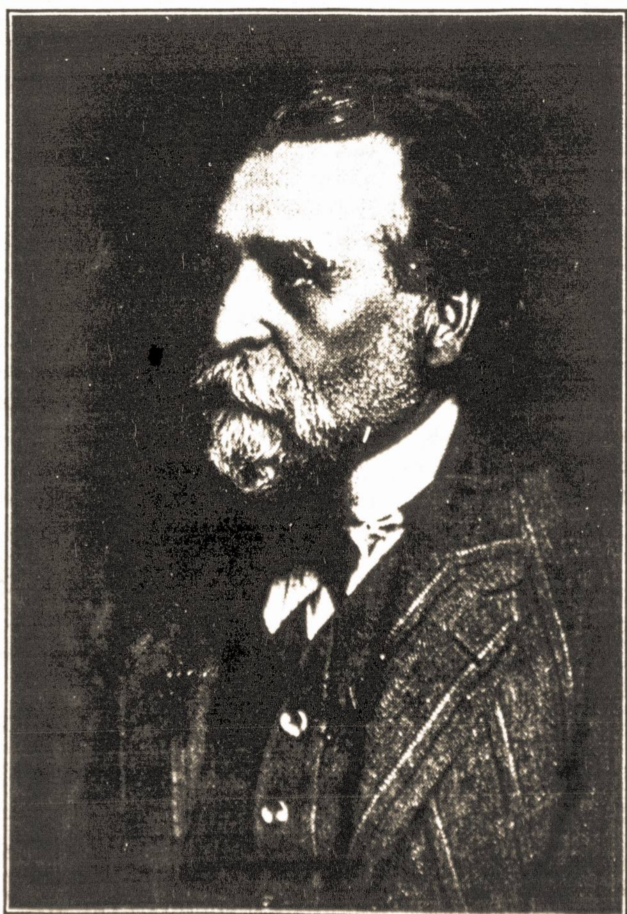
DR. JONAS BASANAVIČIUS

Lietuvių tautinio atgimimo patriarchas, pirmo lietuvių laikraščio „Aušros“ įkurėjas, rašytojas, SLA. Garbės Narys.