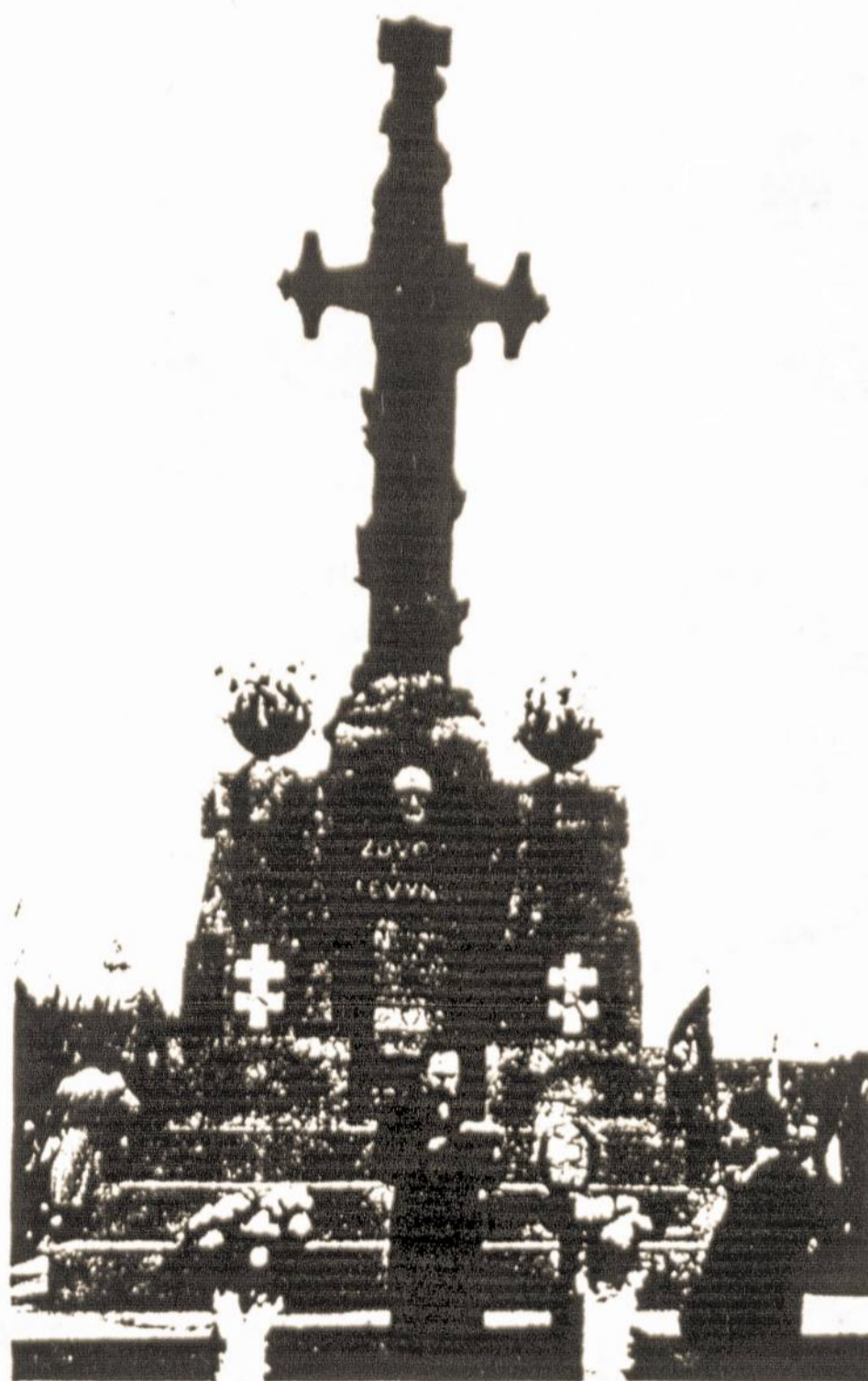
Žuvusiems už Lietuvos laisvę kariams paminklas Kauno kapinėse. Nuotr. iš V. Statkaus knygos „Ginkluotos Lietuvos pajėgos“. A monument in the cemetery of Kaunas commemorates soldiers killed in the Wars of Lithuania's Independence.

Šiaurės Amerikoje populiaru Kaukių diena taip pat turi šaknis Vėlinių papročiuose, nežinoma, kad tai daroma spalio 31 d., o ne Vėlinių išvakarėse, lapkričio 1 d. Persirengę įvairiais, o ypač baisiais, drabužiais vaikai ir suaugusieji, primena iš skaistyklos išleistas vėles, prašinėjančias maldų. Čia persirengėliai reikalauja pinigėlių, saldainių ar kitokių dovanėlių. Už nedavimą žada keršyti, kaip ir vėlės keršydavo neskiriantiems už jas maldų Vėlinių laiką.