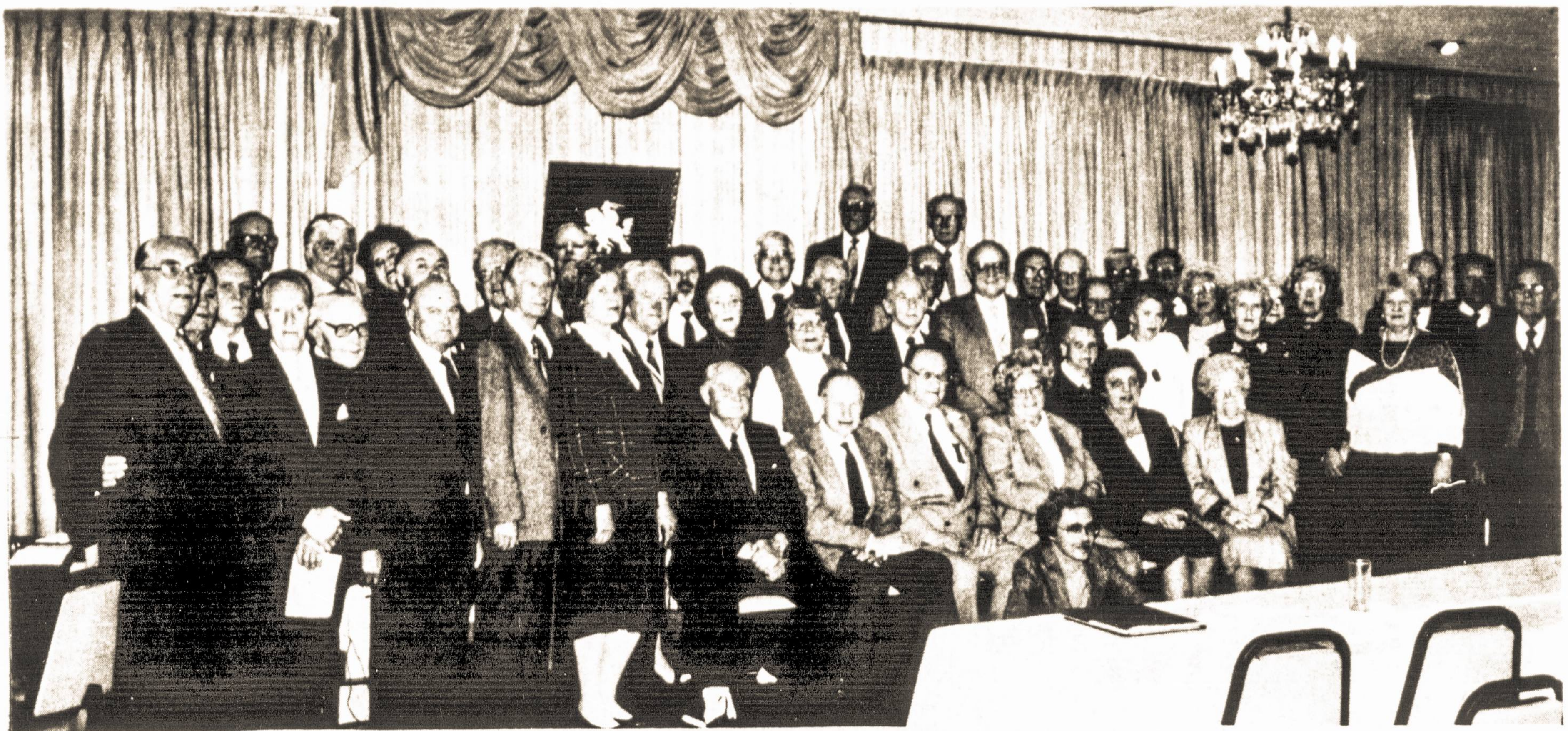
Amerikos Lietuvių Tarybos 51-jo suvažiavimo, įvykusio Liet. Tautiniuose Namuose, Chicagoje, 1991 m. spalio 19 d., dalyvių dalis.