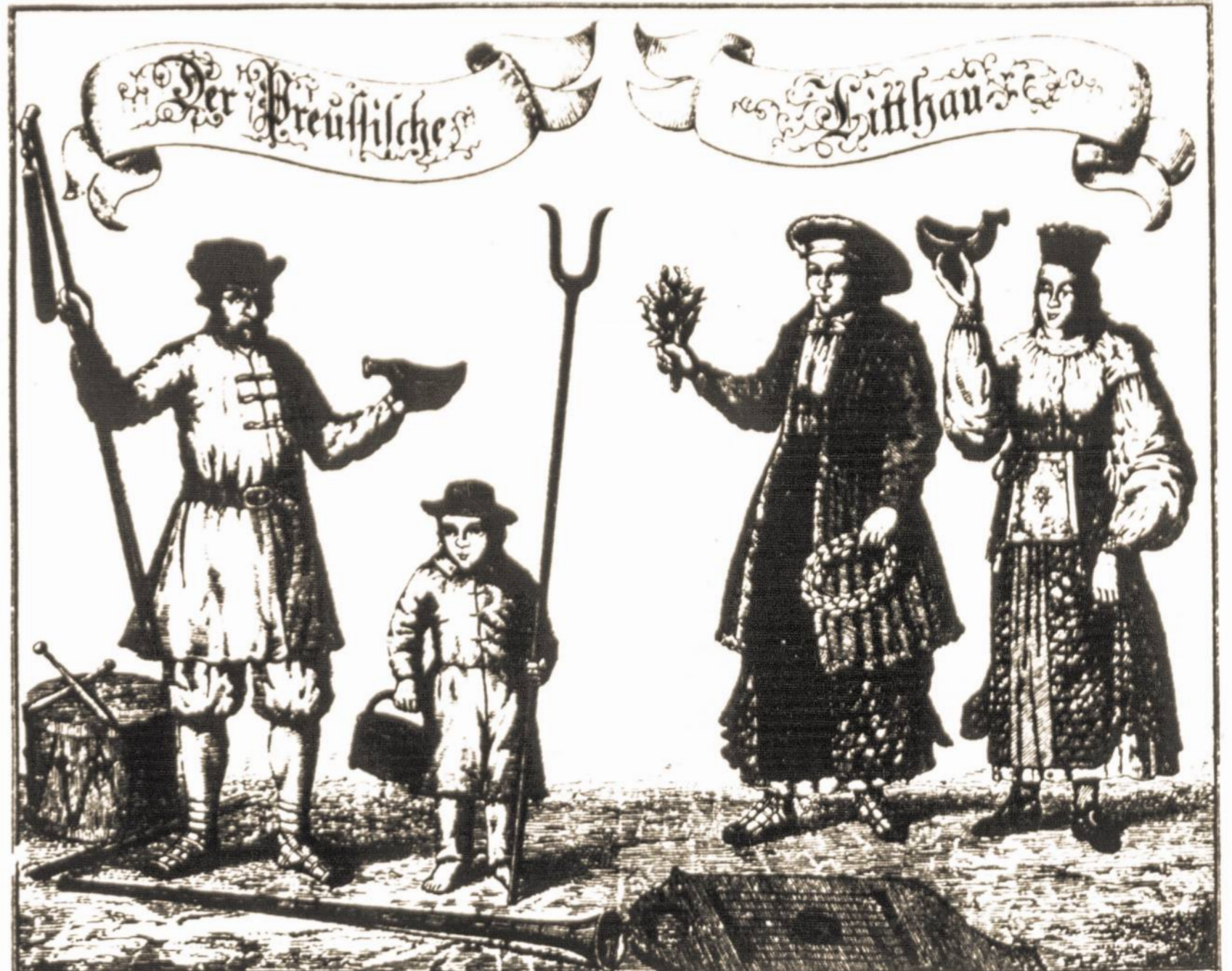
Prūsų lietuviai iš T. Lepner'io „Der Preussische Lithau“, 1848, Tilžė, antra laida. (Pirma laida 1744, Dancigas).

contesting parties, it was agreed that the Lithuanians should make a token withdrawal to allow the French to leave in dignity, with the understanding that the subsequent Council of Ambassadors would satisfactorily settle the question... However, this body appears to have been on of the most inept and incompetent that ever graced the Council boards. They drew up a twin document known as the Memel Convention and Statute, that set the stage for long and