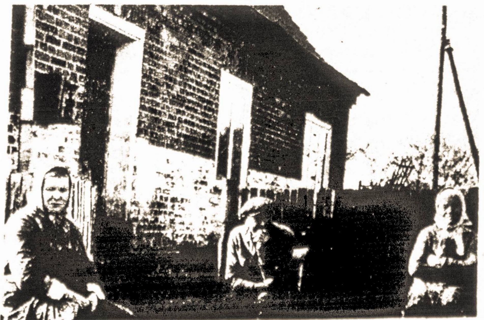
Kači dabartiniai Prūsų Lietuvos gyventojai, 1991

Klaipeda is once again Lithuania's major port city. Having started as an old Lithuanian settlement and conquered by the Teutonic Knights in 1252 who renamed it Memelburg, it is becoming increasingly important as an ice-free seaport, with shipyards and an industrial center. Once again, Klaipeda has become the "window to the world" of an independent Lithuanian republic.