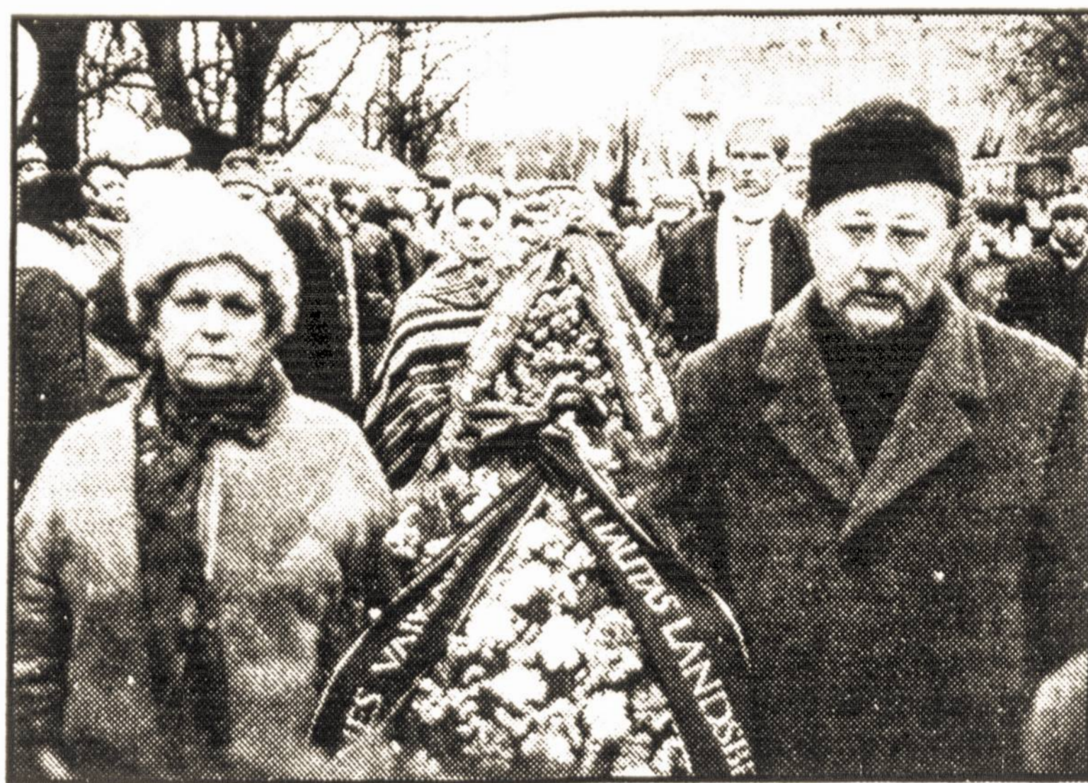
Eisena į kapines