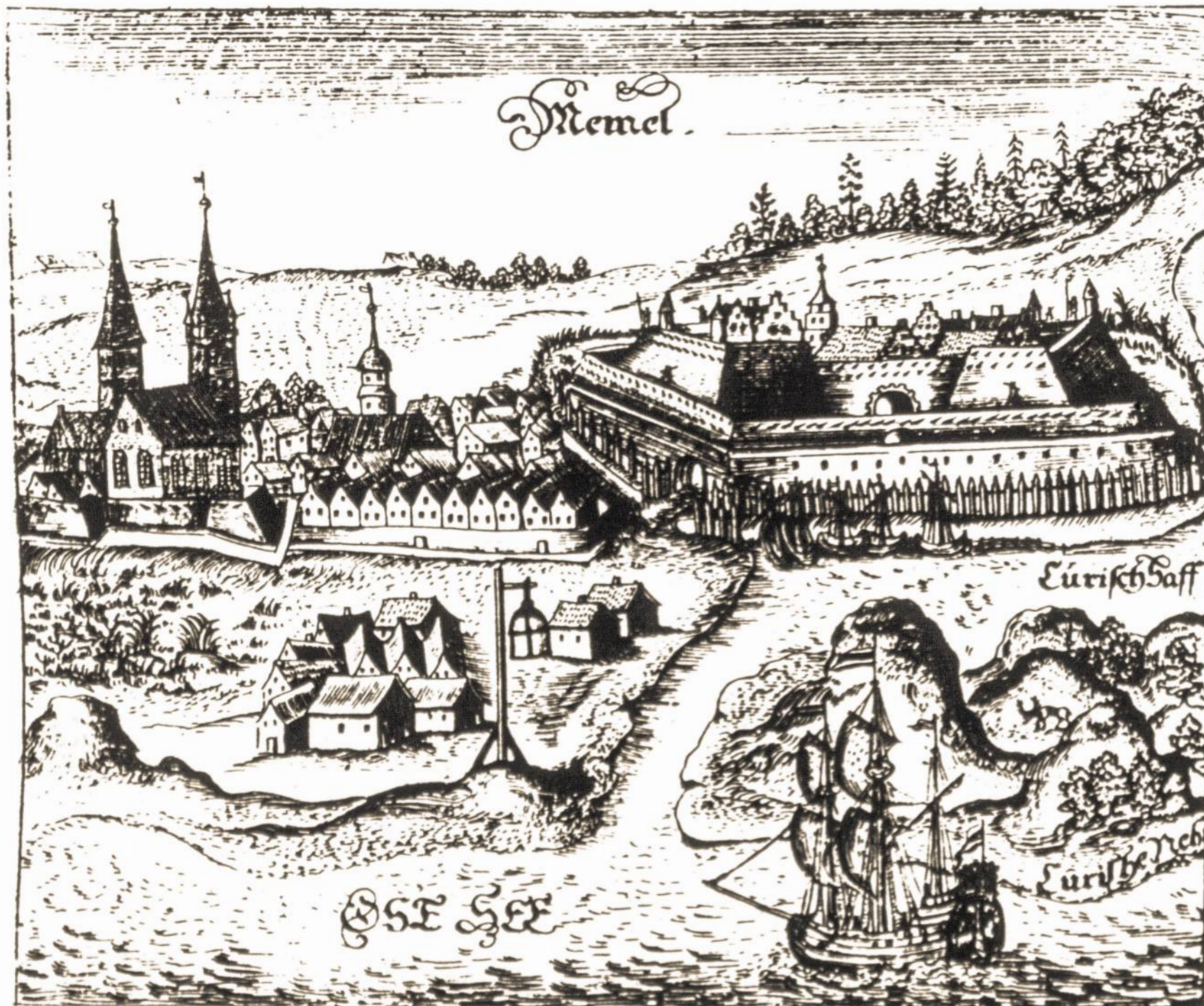
Klaipėdos vaizdas iš C. Hartknoch'o „Alt- und Neues Preussen“, 1684, Frankfurtas/M.

On January 10th, 1923, various groups and bands of Lithuanian troops gathered at the Lithuanian Memelland border to hear the last instructions from Colonel Jonas Budrys and his Captains. The zero hour for this irregular invasion of Memelland had not been definitely set, and there was some hesitation. Sometime before, the Lithuanians had decided to stage an uprising within the Territory since they not only had coveted for some time this natural addition to their land, but were fearful that it might be given a Free State status or handed to the Poles by the Conference of Ambassadors. The Lithuanians marched in, following the people's demonstration at Heydekrug. A weak resistance was put up by the French garrison which was caught napping. In answer to a hasty summons by the French, the British put in at Klaipeda with a small man of war. This British ship threatened to shell the city unless the Lithuanians promptly withdrew. The Lithuanians apparently told them to go right ahead and proceeded with their occupation of the entire territory. After some consultations between the