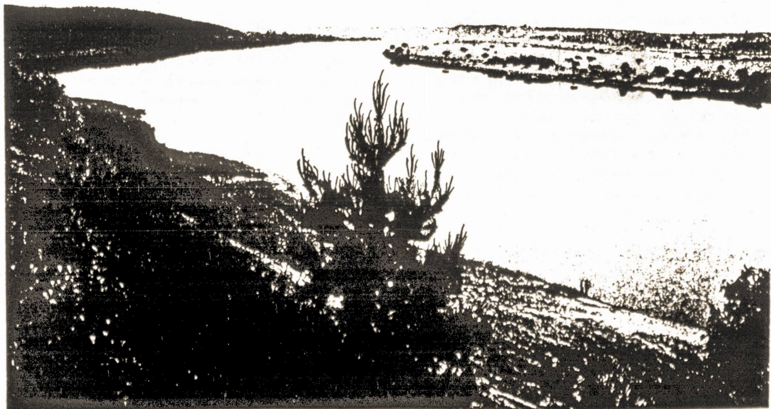
Nemunas — mūsų upių upelių tėvas

Pirmosios žinios apie Nemuną legendinės. Prie tokių priklausė legendos apie lietuvių protėvių protėvio kunigaikščio Palemono bei jo sūnų žygį Nemunu ir apsigyvenimą jo krantuose. Bet tai tik prielaidos, nes nė vieno panemunių piliakalnio, įtvirtinimo, pilkapių tikrų atsiradimo metų nežinome. Tik žinome, jog palei upę jau kadai kadės gyveno žmonės, kad Nemunas padėjo gintis jiems nuo svetimšalių užkariautojų, buvo sunkiausių kovų liudytojas.