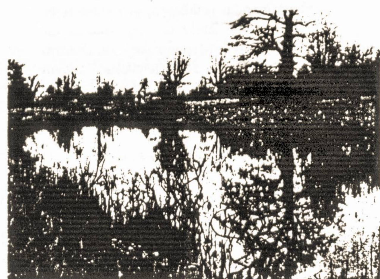
Nemuno užtaka aukštupyje

Žinomas praėjusio šimtmečio istorikas Mykolas Balinskis vadino Nemuną „Lietuvos žemės šerdimi“, o Vilniaus krašto poetas Vladislavas Sirokoplė — šios žemės gyvybės gysla. Nuo senovės laikų Nemunas ir gynė, ir vienijo mūsų gentainius. Su Nemunu atkeliavo į mūsų kraštus civilizacijos naujovės, deja, kartu ir ligos, karai, baisūs senųjų „gadylių kirviai“, išskynę miškus ir nuplukdę juos svetur. Nemunu iš toliau vežta druska, metalas, audiniai, o panemunės gyventojai mainais tiekė kaimynams gintarą, medų, kailius, duoną. Viduramžiais, kol mūsų krašto dar nesiekė geležinkeliai, Nemunas buvo