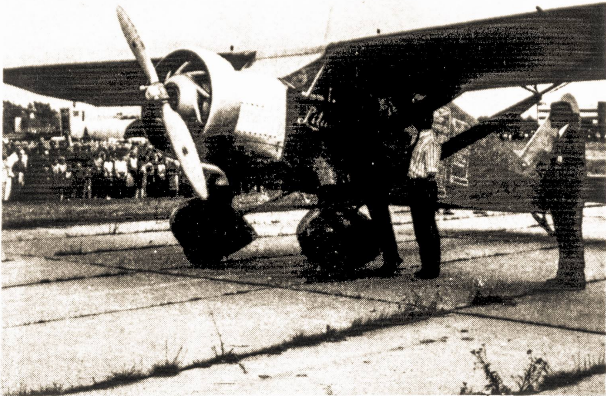
LITUANIKOS -2 sutikimas Aleksoto aerodrome 1993 m. liepos 17 d.