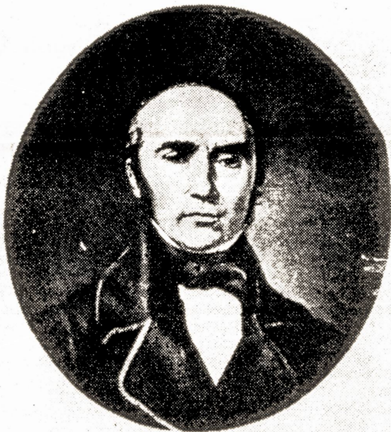
Dail. J. Zenkevičiaus pieštas S. Daukanto portretas. 1850 m.

Valstybinėse įstaigose liepos mėnesį priskaičiuotas vidutinis darbuotojo darbo užmokestis buvo 191 litas, išmokėtasis — 147 litai (palyginti su birželio mėnesiu padidėjo 6,4 proc.).