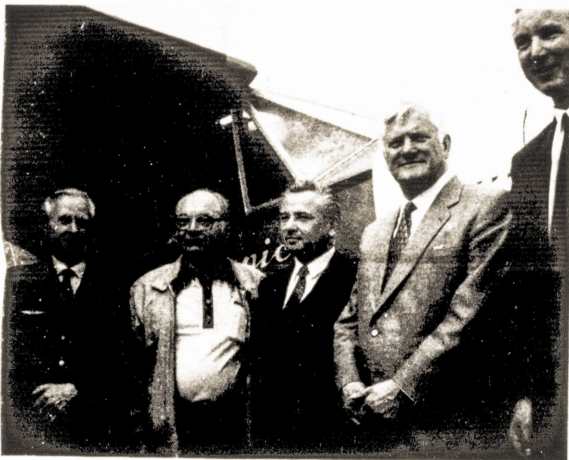
Aleksoto aerodrome, po simbolinio skrydžio, su Lietuvos prezidentu A. Brazausku, min. pirm. A. Šleževičiu ir simboliniu žvilgsniu į erdves.

Išlipusius iš Lituanicos, mudu pasveikino prez. A. Brazauskas, buv. AT pirm. V. Landsbergis, min. pirm. A. Šleževičius. Prezidentas mudviem įteikė po gėlių puokštę, puikų albumą "Einu per Lietuvą" ir apdovanojo specialiu Dariaus ir Girėno medaliu "Už nuopelnus Lietuvos aviacijai". Lietuvos banko valdytojas R. Višokavičius įteikė po naująją Dariaus ir Girėno 10 litų monetą.